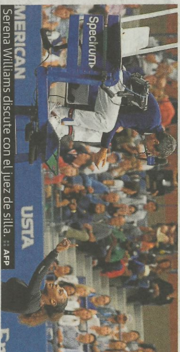
Serena Williams discute con el juez de silla.