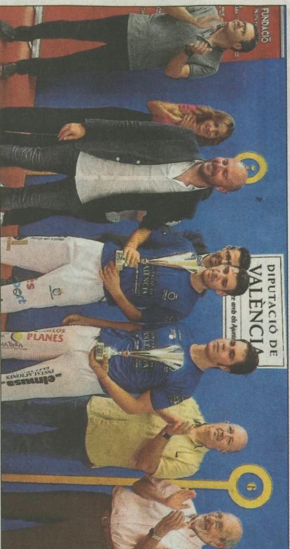
Elsampions amb el president de la Diputació.