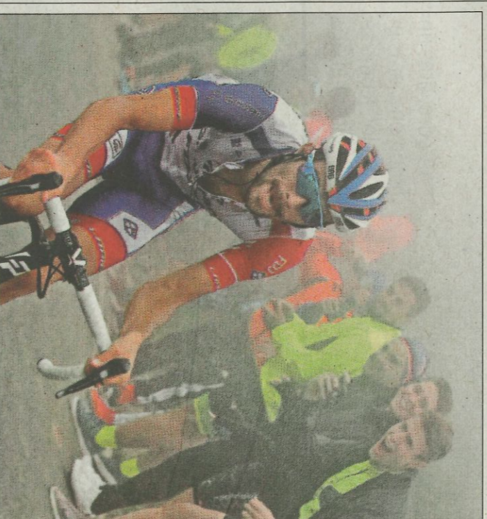
Thibaut Pinot, ayer durante la subida a los Lagos.