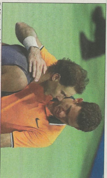
Del Potro despide a Nadal tras el abandono del mallorquín.

un escenario soñado en la progresión que lleva las últimas temporadas. Desde que ganara en 2009 el título en Nueva York ante Federer y se puso como número cuatro del