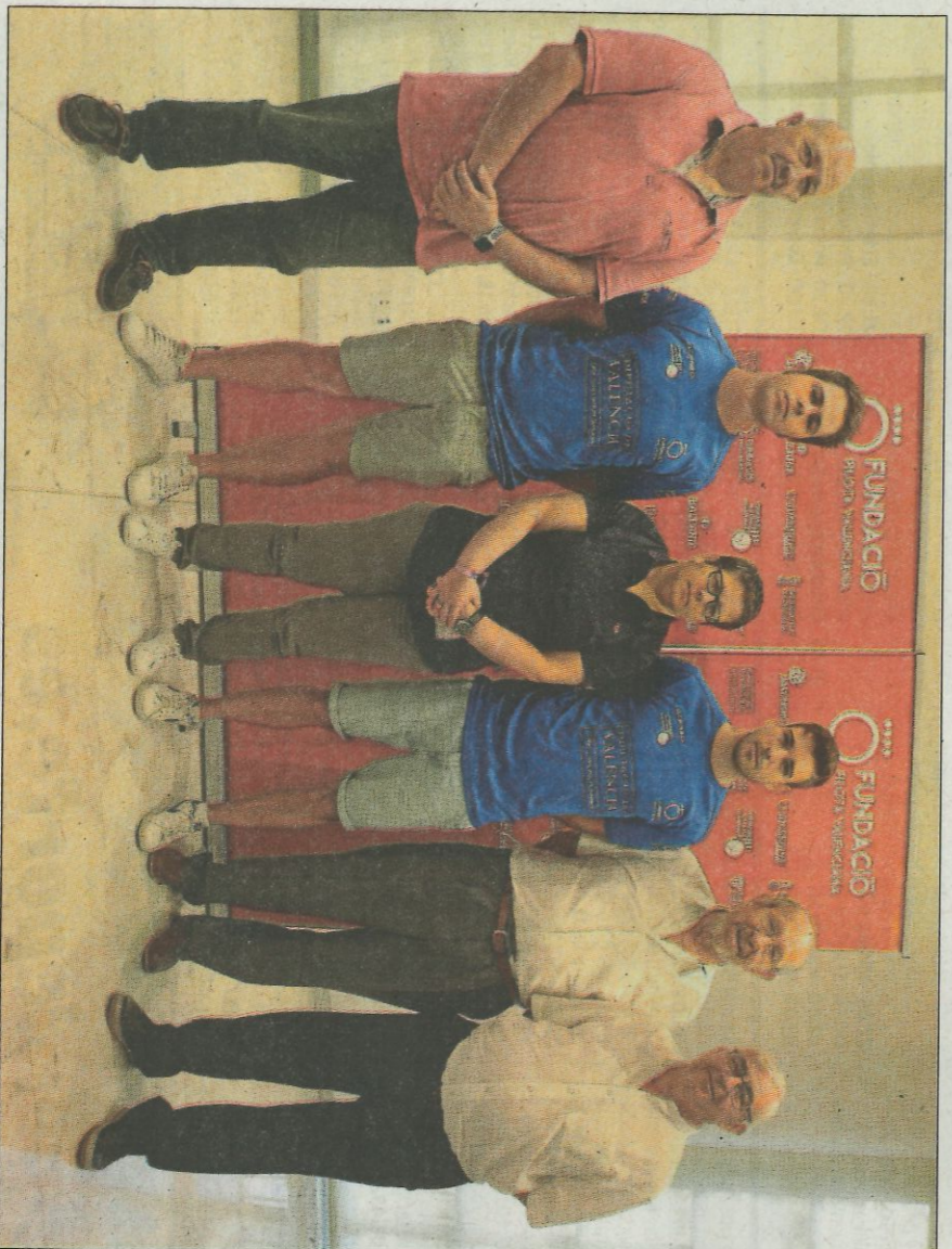
Pilotaris i autoritats en un moment de la presentació a la Diputació de València.

Per a conèixer la configuració del torneig d'escala i corda caldrà esperar un poc. De moment solament ha transcendit que també es completarà amb el format curt de dues semifinals i la final i que començarà la darrera setmana d'este mes. És més que probable que una de les partides es jugue a Pelayo.