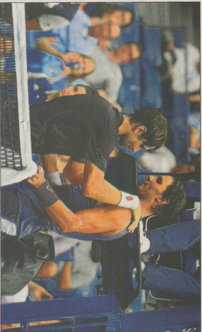
David Ferrer charla con Rafa Nadal tras lesionarse en pleno partido.

Fernando Alonso (McLaren), eliminado en la Q2, y el mexicano Sergio Pérez (Force India) saldrán décimo tercero y decimocuarto, desde la séptima fila.