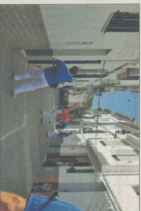
Una partida de galiotxa a Galbiel.

En el cor de molts lluitadors sense més compromís que el de disputar hi ha ferides