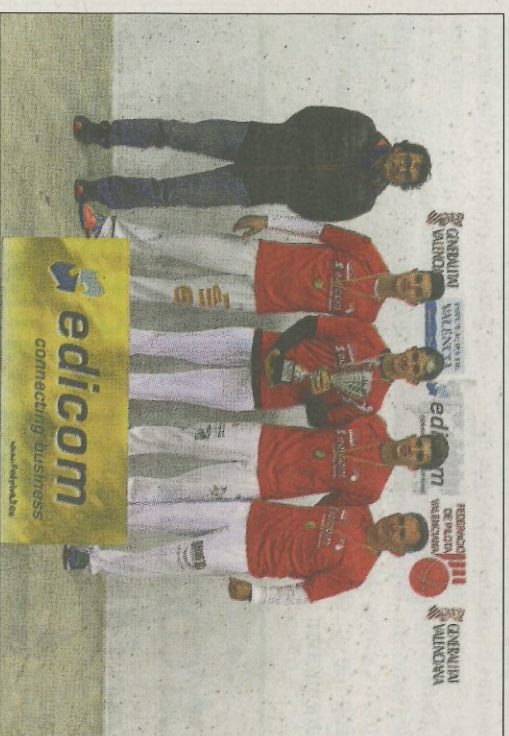
L'Alfara de la Baronia intentarà sumar un nou trofeu. FPV

Marquesat, guanyador en el 2015 i 2016, haurà de superar una setmana més a començar a competir. Tots aquests equips, complint amb la normativa del