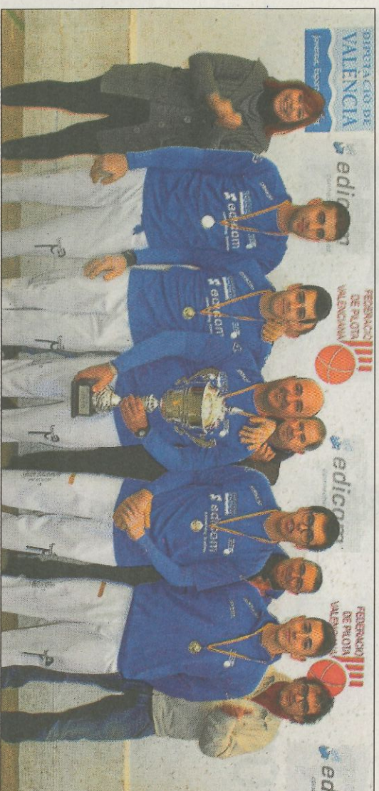
El Lanzadera Montserrat defensarà el títol absolut guanyat en la temporada anterior. FPV

Ja parlant d'aspectes esportius, cinc seran les formacions que es juguen el campionat absolut en la primera categoria de carrer. El Lanzadera Montserrat, campió en l'edició del 2017, començarà la seua defensa del títol jugant davant l'Ajuntament de Beniparrell, en el carrer de la localitat de l'Horta Sud. El Borbotó A, campió en el 2014, jugarà la seua primera partida en casa davant altre ferm candidat al triomf final, el Jamar Quart de les Vallis. Per últim, l'Ovovicty