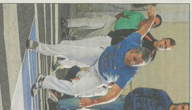
Saorío, al bot durant 2017. FPV

Després de tota una primera volta ja disputada en el Trofeu Diputació d'Alacant, en la seua vessant de la lliga a perxa, la formació de Sella C és la que es situa en el més alt de la classificació, tot i que té una partida pendent contra els seus paisans del Sella A. També cal remarcar, que el Sella B i Benimarell també compten amb una partida menys. De moment, el l'lder, com deiem, és el Sella C amb 7 punts i 3 partides disputades, Castells és segon amb 6 punts i 4 partides disputades. Sella B i Benimarell empaten en tercera posició amb 4 punts i tanca la classificació el Sella A amb 3 punts. Murtxamel i Sant Vicent encapçalen el grup A de segona, amb 7 punts, i a més, els dos equips han disputat una partida menys que la resta. A continuació, Rellou i Agost també