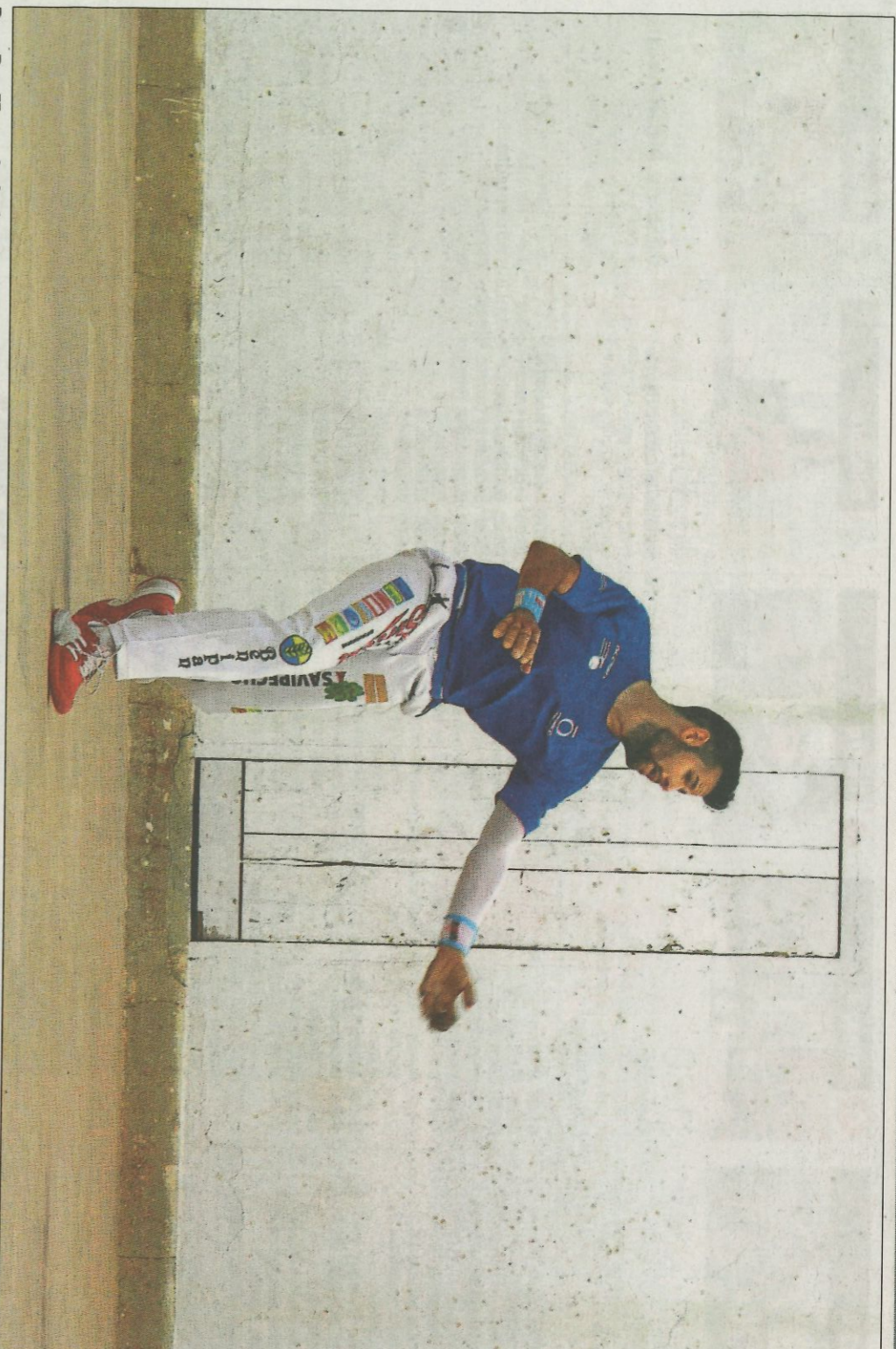
Pere Roc II canviarà el seu recinte habitual i passarà del trinquet al frontó, hui diumenge a Vilamarxant. FUNDACIÓ.