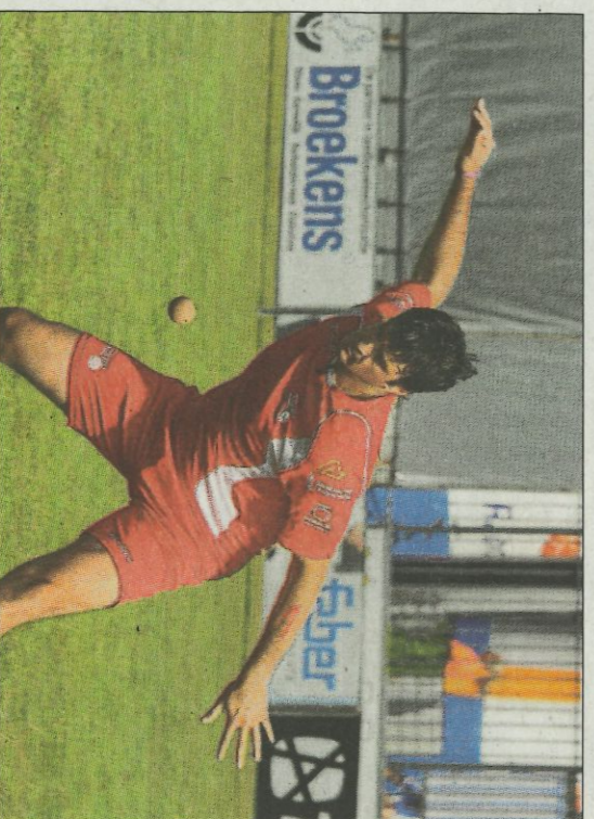
Per a Pigat II, Genovés II ha sigut el millor participant de l'Europeu. FIV

Dins d'este grup, l'Europeu d'Holandia ha tingut un nom propi. «S'ha meregut guanyar el títol al millor jugador del campionat. Ha tornat a demostrar que és un pilotari excepcional i un gran líder que sap gestionar tots els moments. Quan ha de relaxar l'ambient ho fa i quan es necessita tindre tensió l'aporta. I en les situacions crítiques