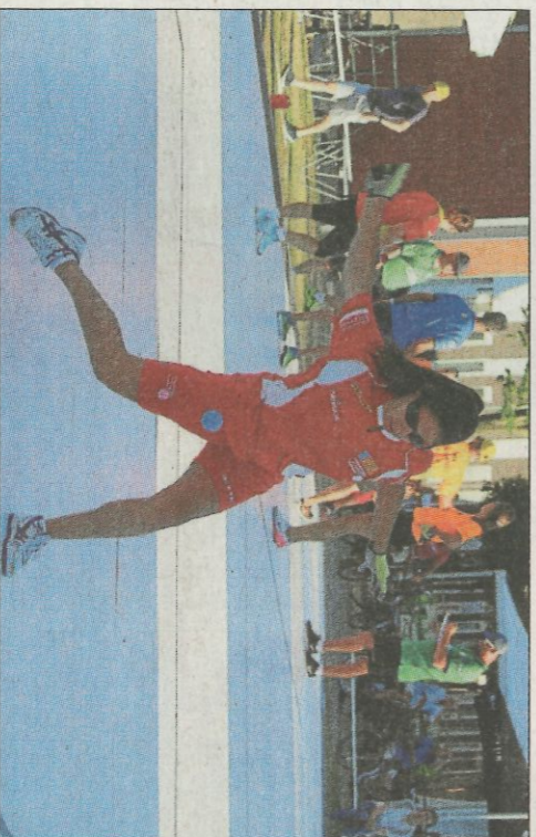
Mar jugarà hui la final femenina individual de wallball. FEDPIVAL

Això va implicar que hi haguera menys temps de descans i que els pilotaris menjarien entre temps morts. Però va ser per a tots igual. I la veritat és que el muntatge dels organitzadors havia suposat un esforç important. Per això es va entendre la decisió i es va acordar esperar que