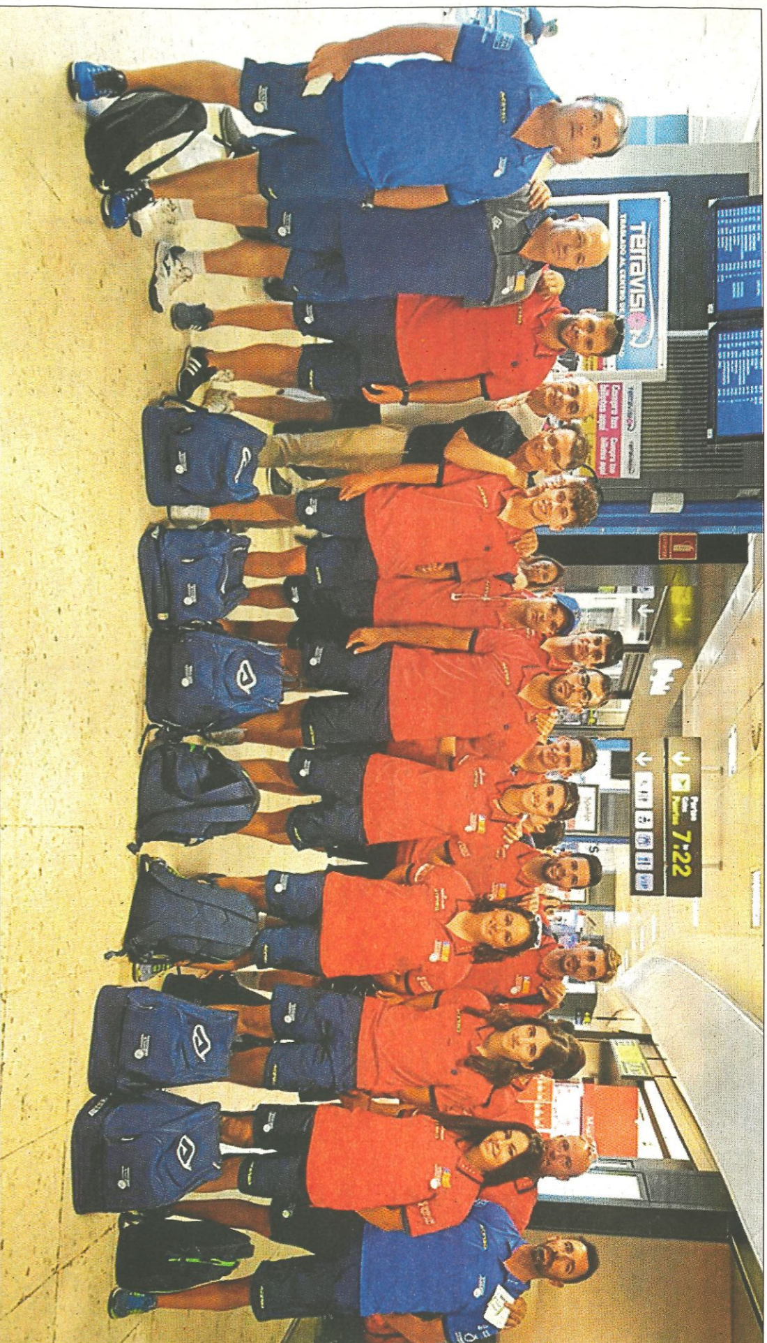
L'expedició valenciana abans d'eixir cap a Holanda, ahir a l'Aeroport de Manises.