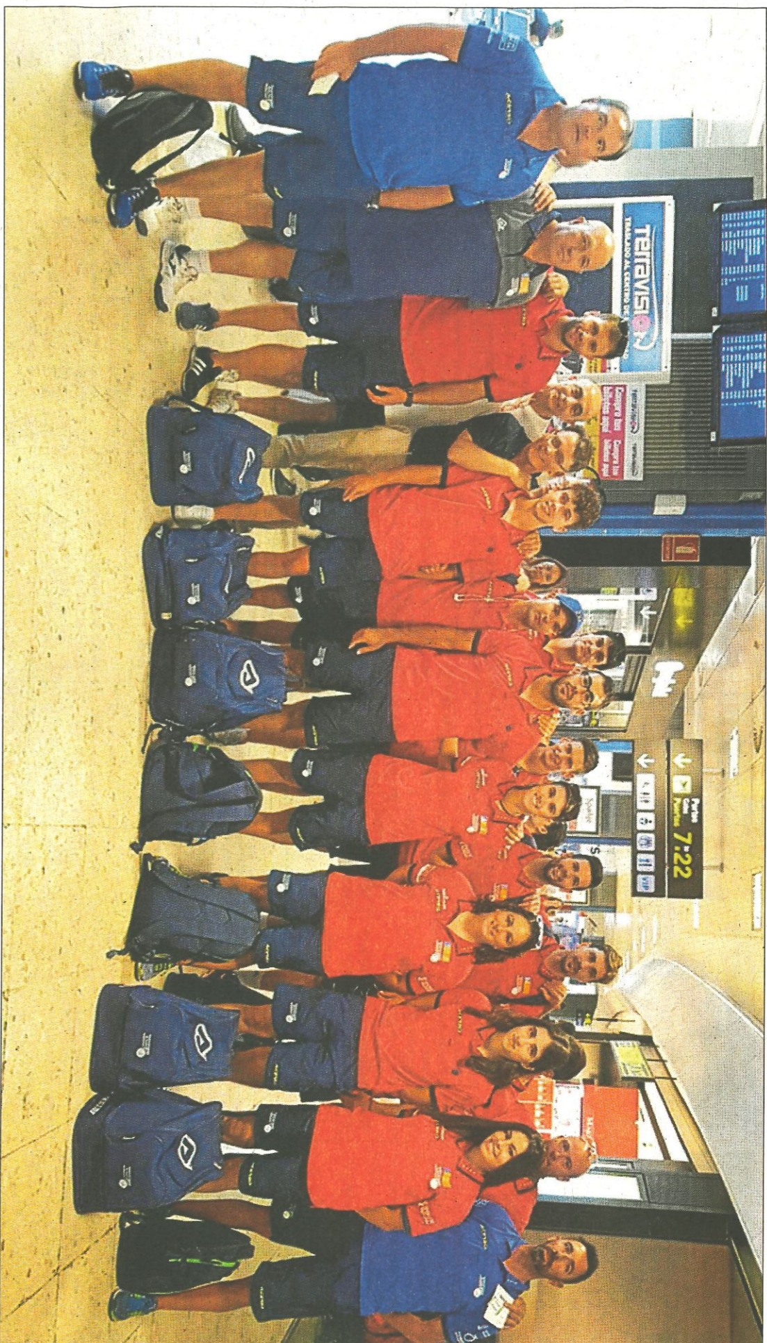
L'expedició valenciana abans d'edir cap a Holanda, ahir a l'Aeroport de Manises. FEDPIVAL