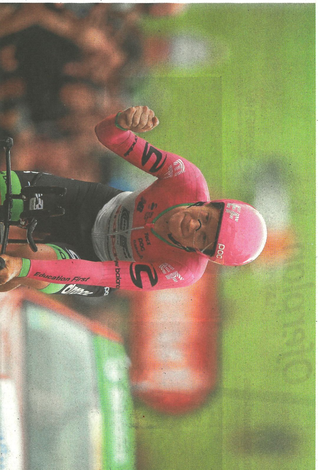
Lawson Craddock (Education First) celebra el final de la última prueba contra el crono del Tour de Francia.

La iniciativa de Craddock produjo un efecto llamada y ha recaudado 166.000 euros para el velódromo