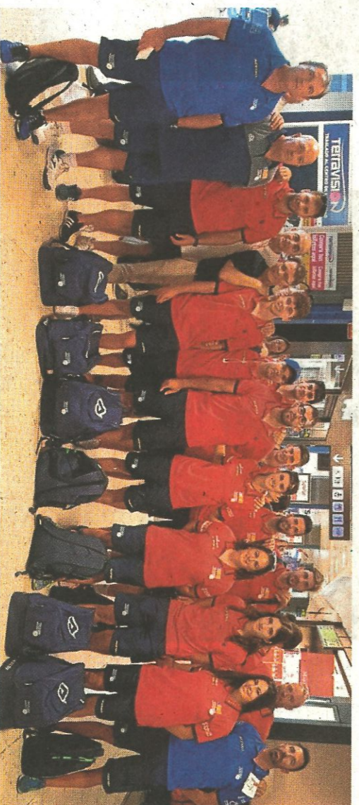
Expedición de la Selección Valenciana, instantes antes de partir ayer hacia Holanda.

Como publicó el domingo este diario, la competición de llargues, la más importante y que cerrará el sábado el Campeonato de Europa que arranca mañana, se jugará sobre una tarima. Las canchas para el one wall, torneos que tendrán lugar el viernes, también se han confeccionado con materiales prefabricados. Los hombres y mujeres que componen la expedición de la Co-