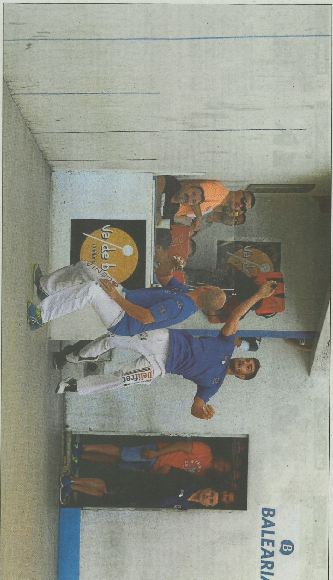
Francés ha sigut el millor participant del Trofeu Ciutat de Torrent, que ha reunit a la bona part de les primeres figures del moment. FUMPIVAL