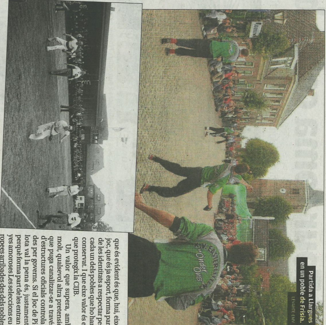
Partida a Llargues en un poble de Frisia.

Allí, en eixa cita que és esport, cultura i identitat, estaran totes les delegacions que un dia després, competiran, durant tres jornades, pel X Camionat d'Europa que organitza la CIJB. El PC de Franeker, ciutat de 13.000 habitants, se celebra ininterrompudament des de l'any 1854. Qualsevol aficionat de la Marina entendrà perfectament