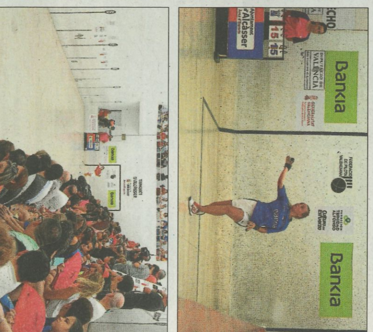
Les finalistes del Individual mostren un gran nivell i es fotografaren amb jugadores destacades dels JECV. FPV