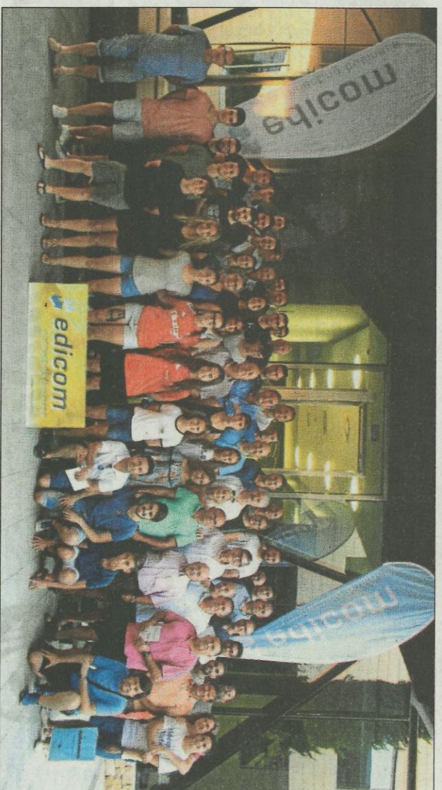
Edicom acollirà la presentació del 32è Campionat Interpobles de Galotxa. FPV