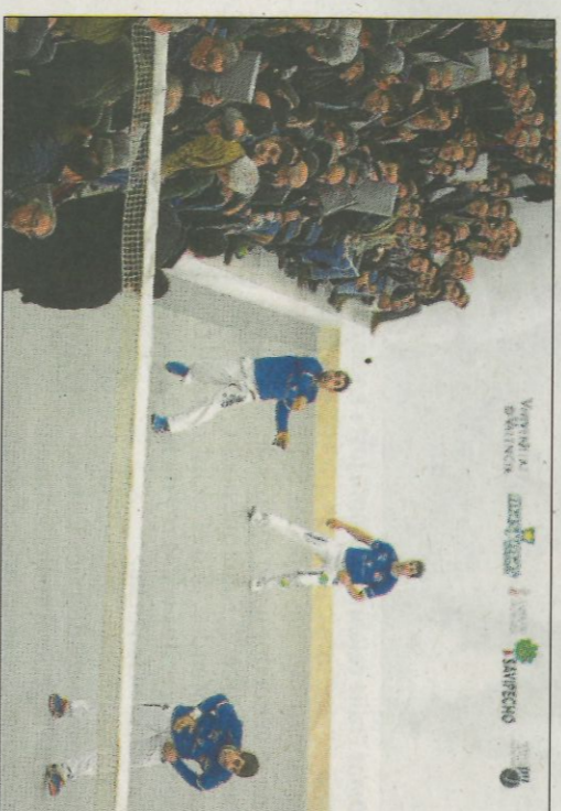
Una partida en La Catedral de la pilota. MAO

El Ayuntamiento de Valencia acaba de otorgar la medalla de oro de la ciudad al Trinquet de Pelayo, en reconocimiento a su detalle que el mundo de la pelota agradece. A punto de co-