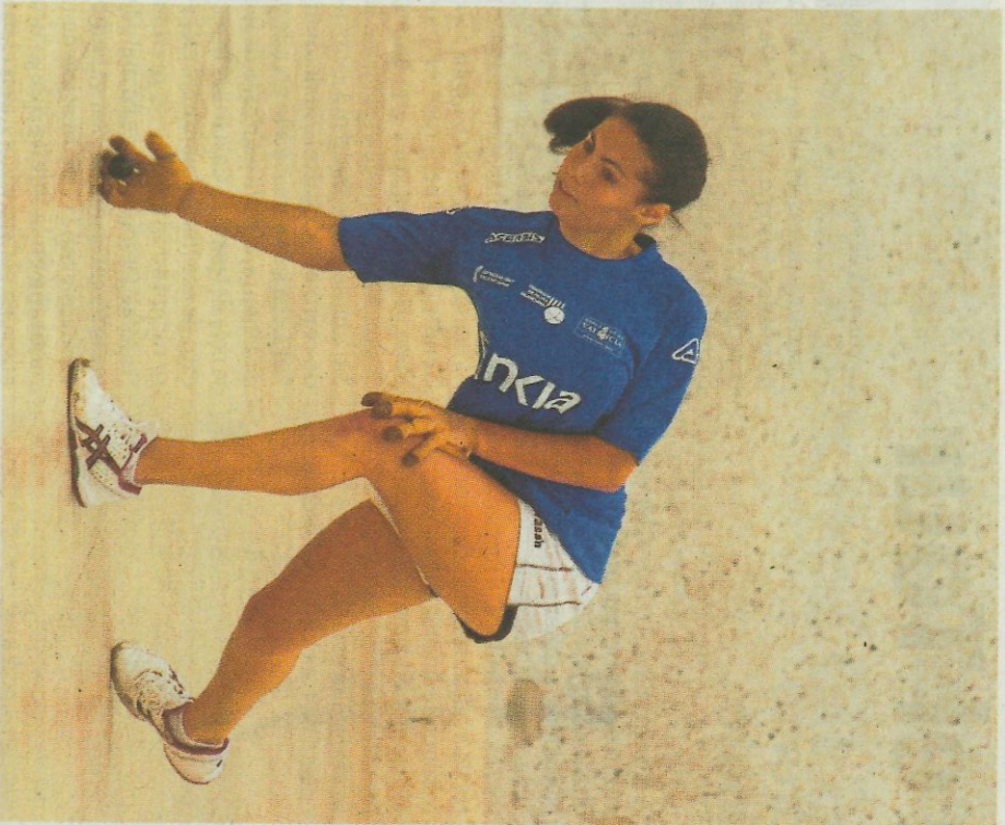
Mar de Bicorp. :: FVV