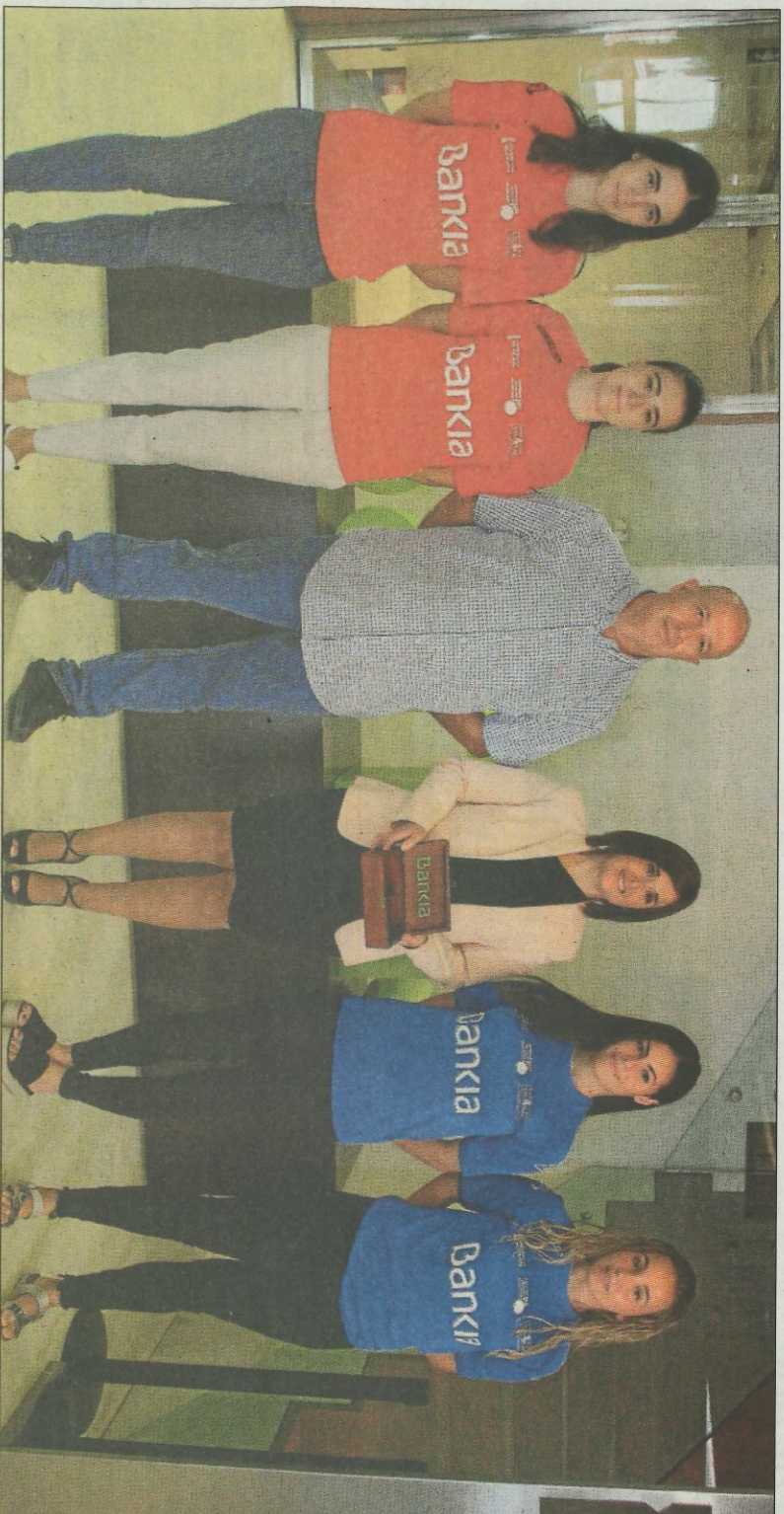
Finalistes Individual Bankia raspall 2018, amb autoritats. SD