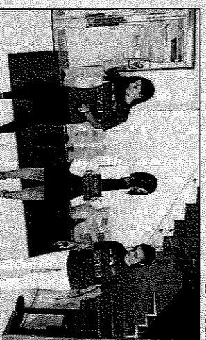
Moment de la tria de pilotes per a la final.

Ahí, en la seu central de Bankia, dos joves xiques procedents de Biscorpi de Beniparrell, i altres dos arribades des de Moixent i Valencia, triaven amb mínim i concentració les pilotes de vaqueta que usaran en les finals de diumenge que