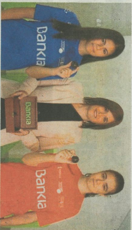
Las finalistas y la directora comercial de Bankia.