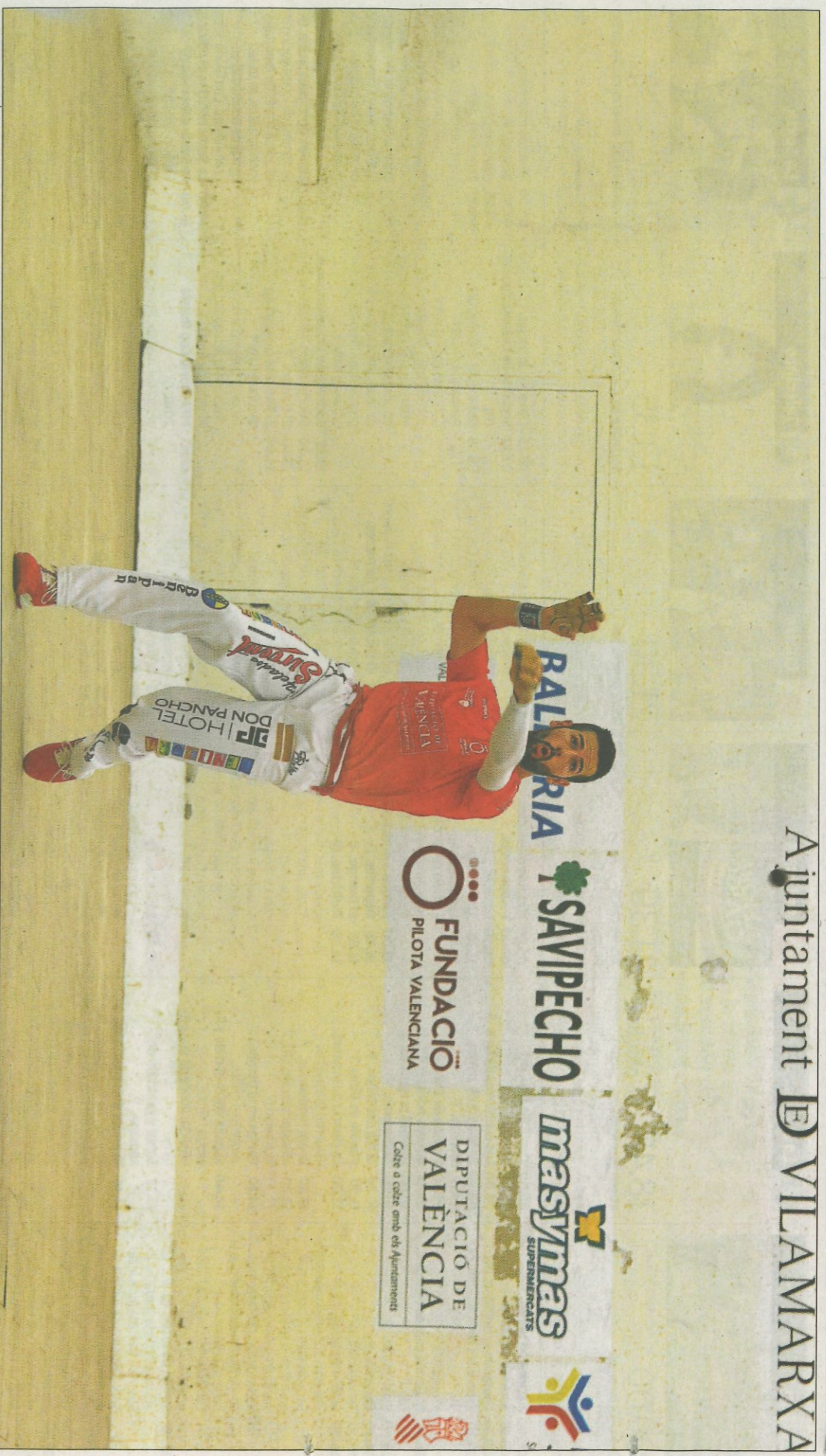
Pere Roc II intentarà escometre a la pilota per davant i d'aire. FUMIPVAL