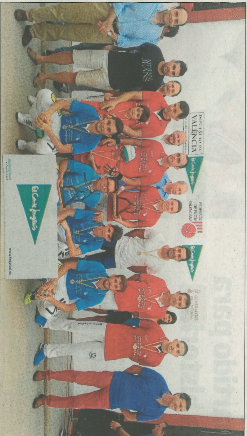
Protagonistes de la final de El Corte Inglés, ahir amb els seus trofeus.

La final tornà a congregat a centenars d'aficionats a pesar de