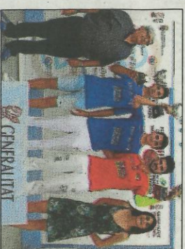
Finalistes Sub-18.