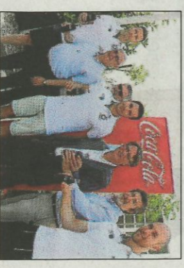
Moment de la presentació.