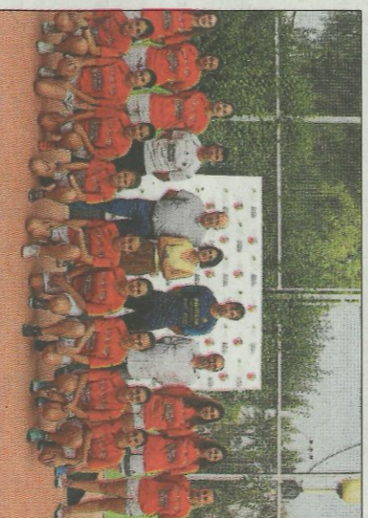
Grup de les categories femenines amb autoritats i exhibició.