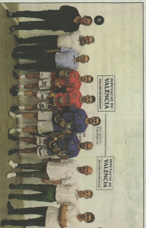
Foto de família amb els finalistes i les autoritats.