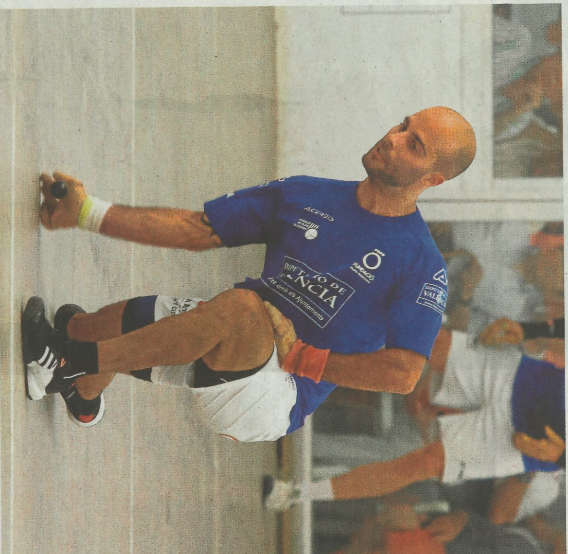
Brisca raspa con seguridad una pelota desde el dau. MARI CARMEN MONTES

Contó Brisca en la final de la Copa con un sobrio Mario. Eso le ayudó. Lo contrario que Néstor a Moltó. El resto de Barxeta estuvo a un gran nivel, pero el de Pego no brilló a su mejor nivel. Después de ceder el primer juego desde el dau, los rojos