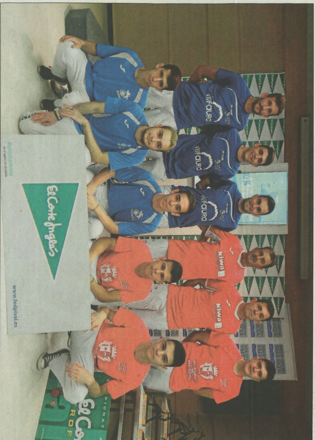
Finalistes de primera de juvenils que jugaran a Beniparrell. FEDPIVAL.