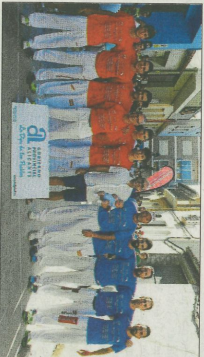
Benidorm i El Campello reediten la final de llargues de 2017. FPV

fer un resum de les activitats més destacades per a les ratlles durant els últims mesos, destacant la unió dels que practiquen aquesta modalitat. «Des de la Federació hem