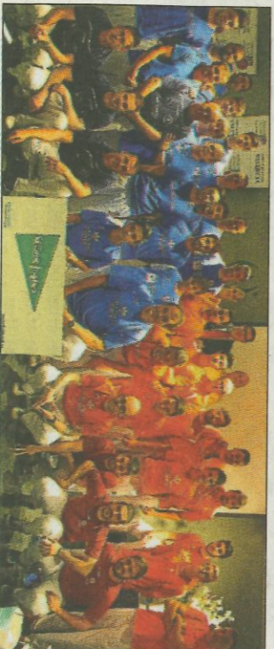
Tots els jugadors del cap de setmana de les finals en Torrent. FPV

Ja el diumenge tindrem dues sessions, una matinal i altra vespertina. A les 9:30 del matí, per a poder