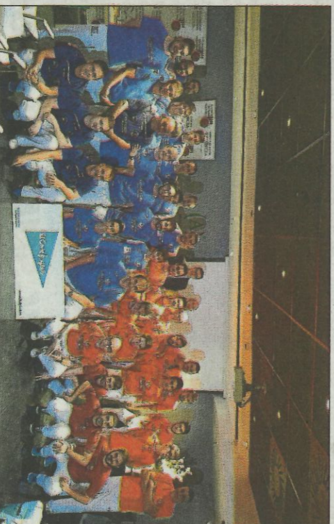
Imatge de la presentació de les finals d'El Corte Inglés.