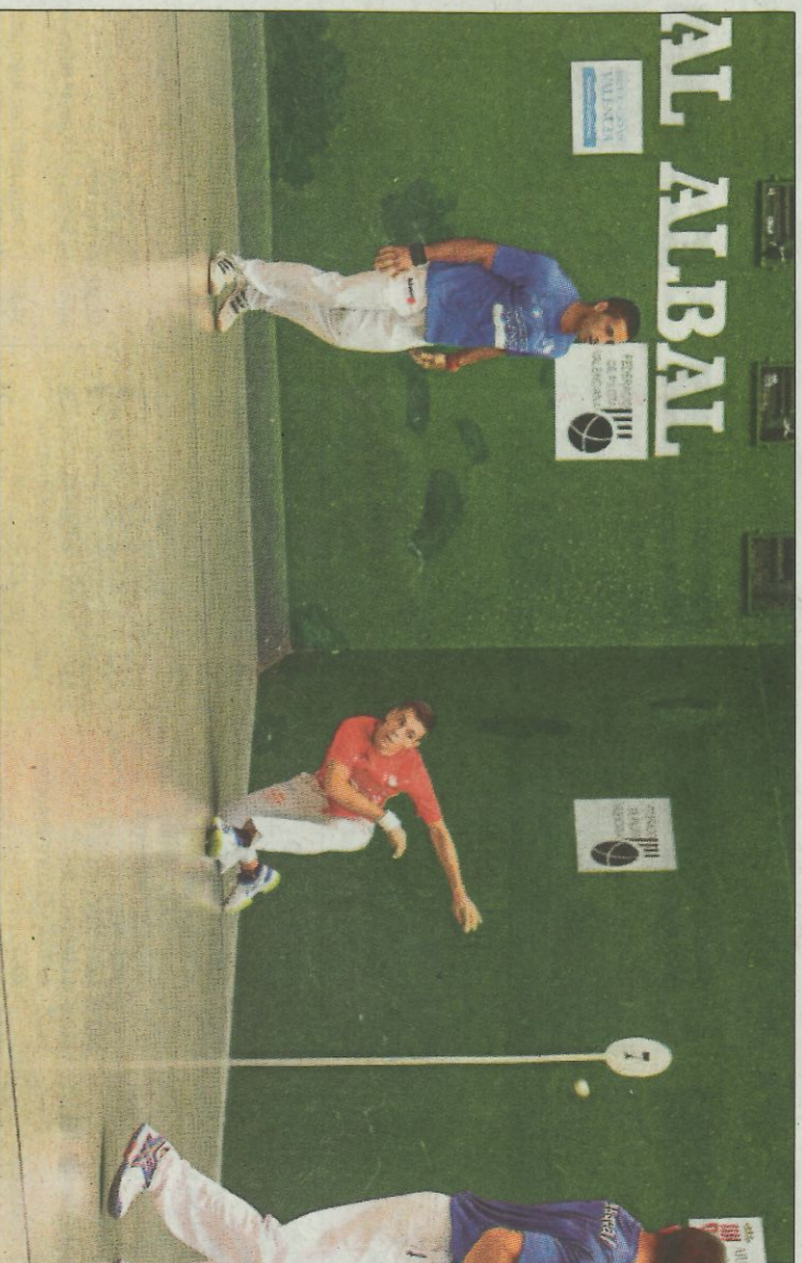
El frontó de la cooperativa d'Albal acollia les finals en 2016. SD