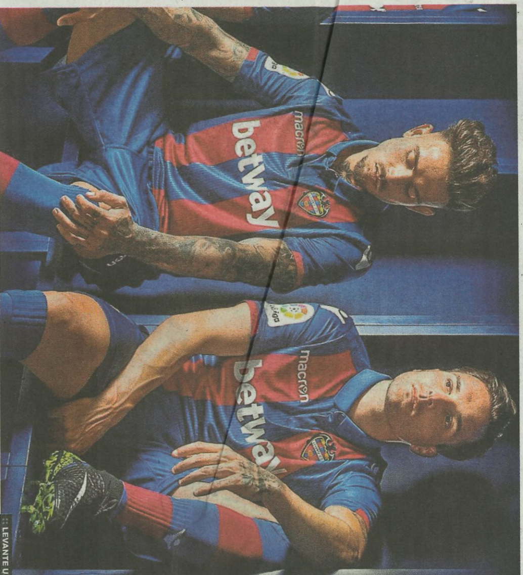
++ LEVANTE UD

Esta compañía ha patrocinado al West Ham inglés, el Werder Bremen alemán y el Anderlecht belga. Ade-