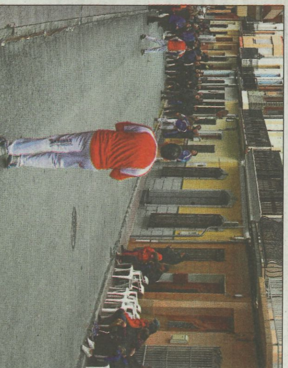
El carrer de Benitaxell ha sigut escenari de nombroses partides. SD

Tots estos jugadors repetixen final respecte de l'any passat, llevat de Zarzo que no participava l'any passat. Una vegada més, l'Ajuntament d'Albal es fa càrrec de la celebració de les finals al frontó de la cooperativa, tradicional recinte on s'han disputat ja infinitat de partides i finals i que a més és habitual en totes les competicions federatives de pílotat.