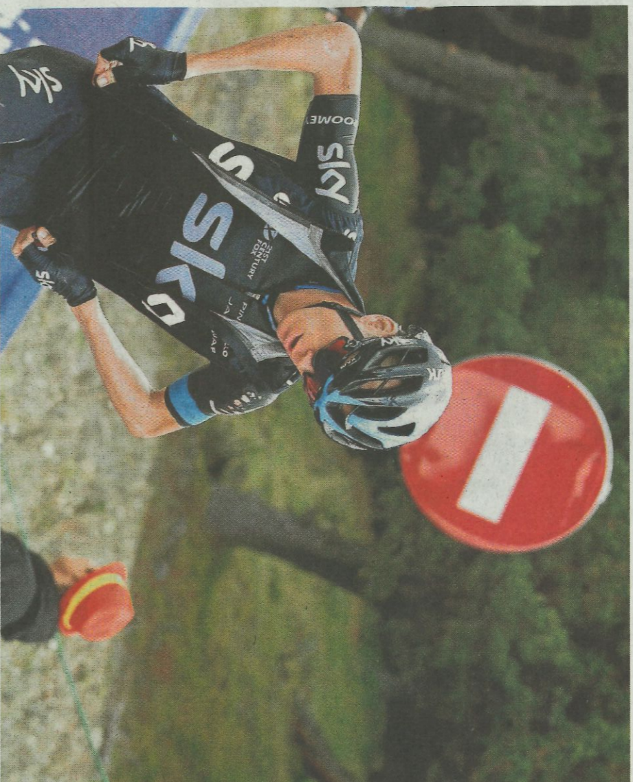
Froome, durante la pasada Vuelta, donde dio positivo.

Lleva meses estudiando tomar una media. La opinión pública francesa esta harta de escándalos. Por eso, la organización de la carrera ha recurrido al artículo 28.1 del reglamento del Tour de Francia: una carrera se reserva el derecho de vetar a un ciclista o a un equipo si atenta contra la buena imagen de la propia carrera o de los organizadores.