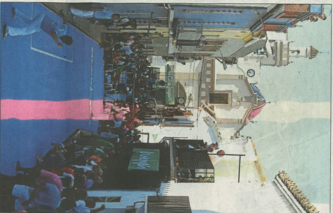
Panoràmica del carrer València, en Quart de les Valls.