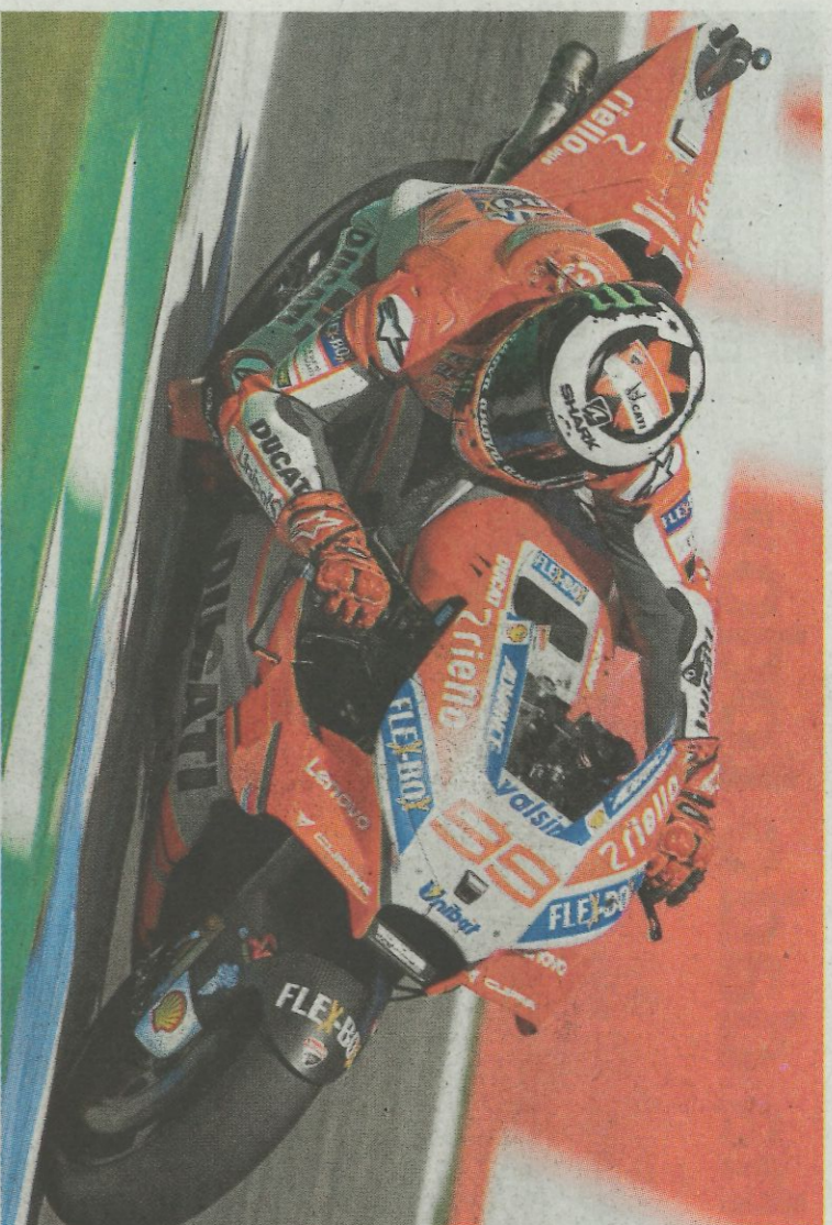
Jorge Lorenzo rueda ayer en Assen.