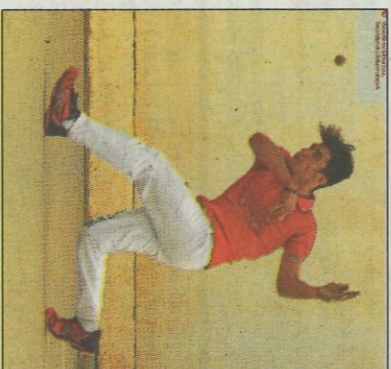
Massamagrell (dalt) va aconseguir el dobllet en infantils i alevins. SD