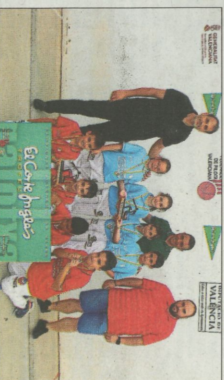
Els benjamins de Moixent i El Puig jugaren la final més disputada. SD

equips finalistes (Moixent i Montserrat), amb el que es demostra que les xiques també van entrant en la competició escolar del principal torneig de la modalitat.