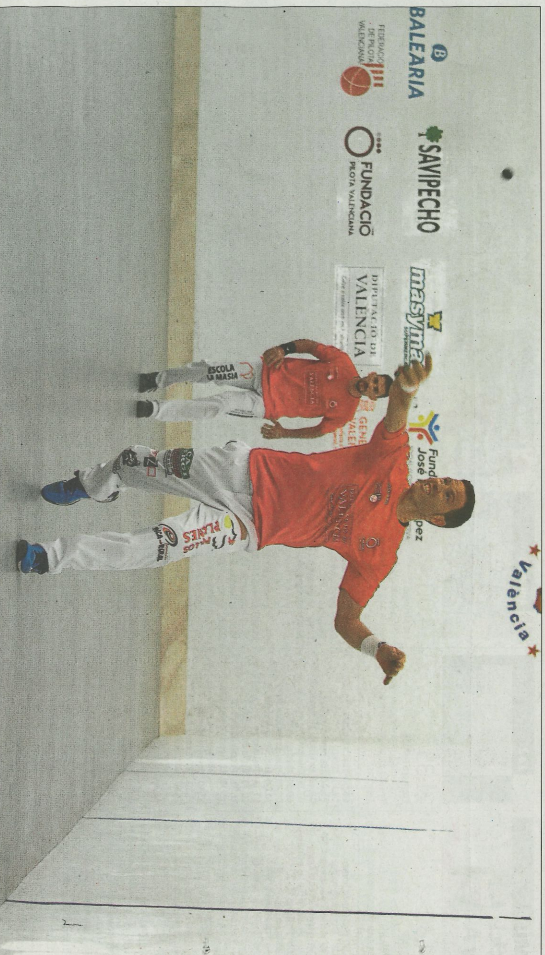
La Copa Diputació de València d'escala i corda també va tindre activitat ahir. Va ser a Pelayo on Soro III i Salva aconseguiren la primera victòria.