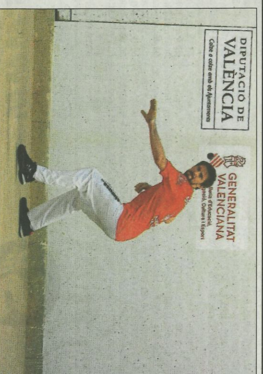
Soro III és l'actual campió individual d'escala i corda. FUNDACIÓ

Ara es torna a obrir este procés de selecció amb el qual s'espera que les creacions que es presenten acaben convertint-se en el símbol d'una de les competicions més importants d'este esport. Una peça única que estarà al l'abast de només uns pocs, dels reis de la pilota professional.