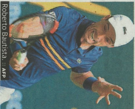
Roberto Bautista...