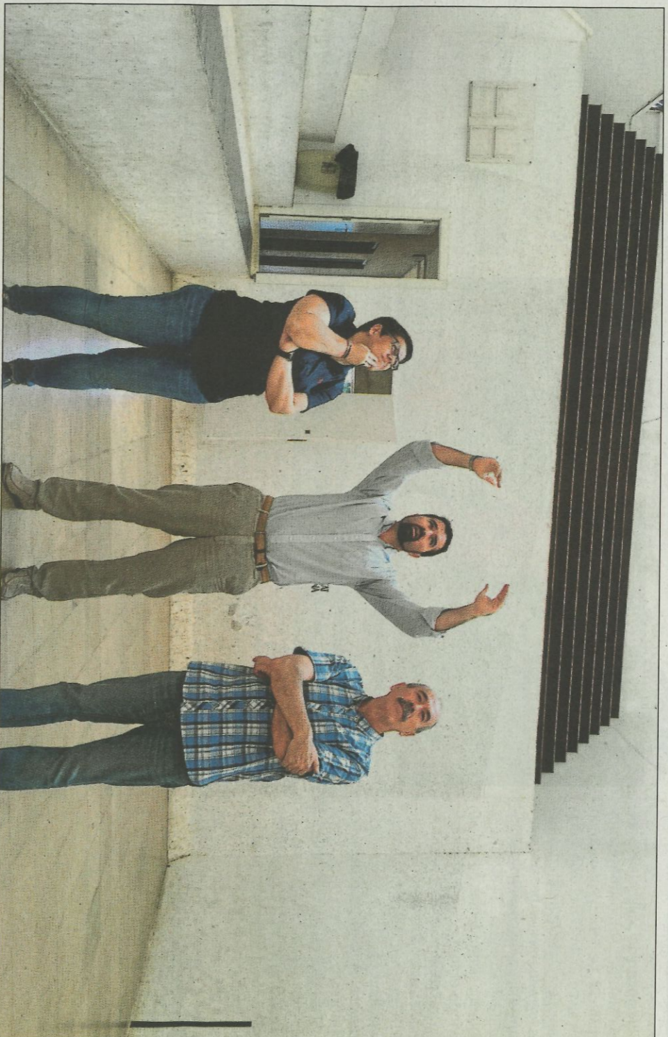
La diputada de Igualdad y Deportes, Isabel García, durante la visita que realizó a Canals.

La diputada de Deportes, Isabel García, ha visitado las instalaciones deportivas y el trinquete municipal de Canals, acompañada por el alcalde y concejal de Juventud, Ricardo Requena, y el concejal de Deportes, José Ramón Garrido. Un recorrido en el que se ha comprobado el estado de la cubierta, los vestuarios y el alumbrado de un recinto deportivo que data de 1977, y que serán renovados con la ayuda de la Diputació. García ha destacado durante su visita al municipio de la Costera que la Diputació siempre va a estar al lado de los ayuntamientos que luchan por preservar el deporte local. «Las niñas y niños que quieren jugar a pilota desde la base se encuentran en muchos casos con trinquetes muy deteriorados, y lo que se pretende con esta renova-