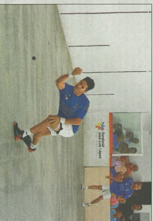
Miravalles s'ha incorporat amb bon peu a la Copa. FUNDACIÓ

Els dos equips han estat castigats per les lesions en esta fase. El de Genovés ja és el titular amb la incorporació de Miravalles i de moment està funcionant bé. El trio és una incògnita després dels canvis. Però hi ha potencial i en són un més.