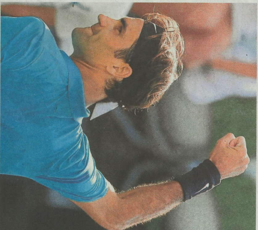
Federer celebra el triunfo ante Kyrgios.

Nadal está preparando Wimbledon de forma distinta tras vencer de nuevo Roland Garros. Después de ganar su undécimo título en París y anunciar que no competirá en Queen's para descansar, Nadal re-