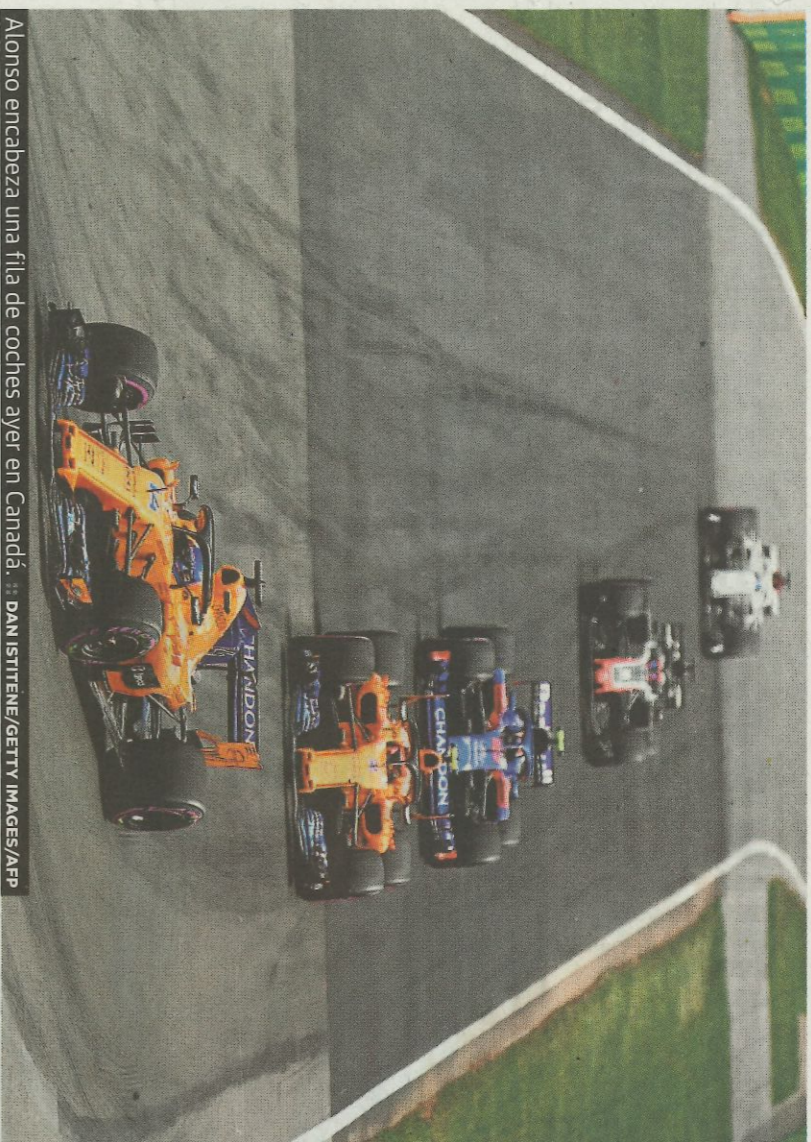
Alonso encabeza una fila de coches ayer en Canadá.