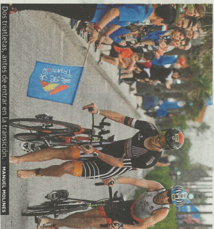
Dos triatletas, antes de entrar en la transición.