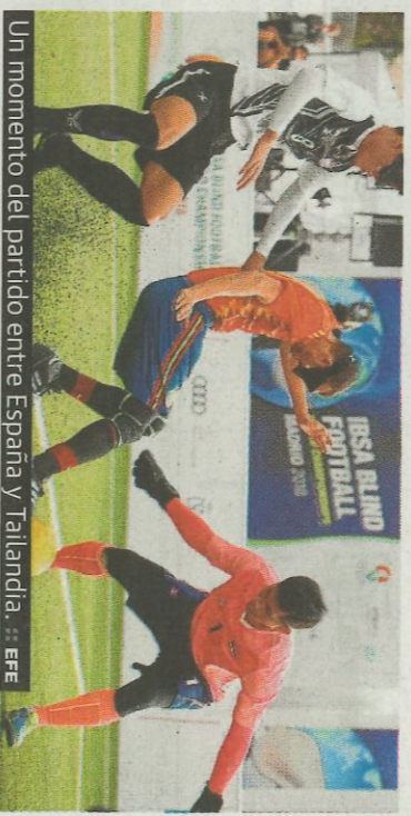
Un momento del partido entre España y Tailandia. :: EFE

AUTOMOVILISMO :: EFE. El francés Sebastien Ogier (Ford) afrontará la última etapa del Rally de Italia-Cerdeña al frente de la clasificación, tras resistir ayer el acoso del belga Thierry Neuville (Hyundai), que se situó a 3.9 segundos del pentacampeón mundial. Ogier sufrió lo indecible para contener los ataques de Neuville.