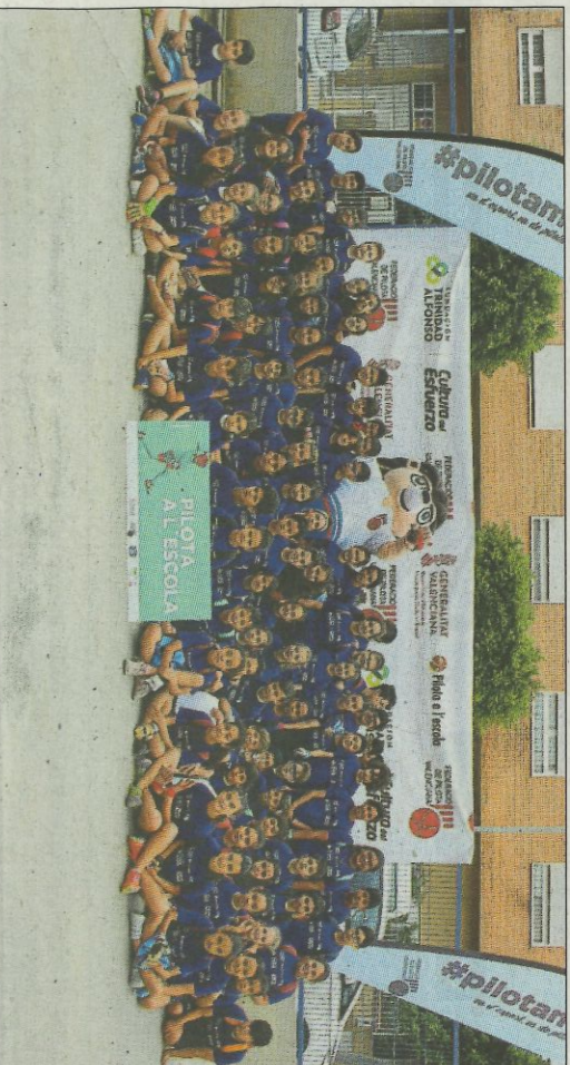
CEIP N. Estreban. SP