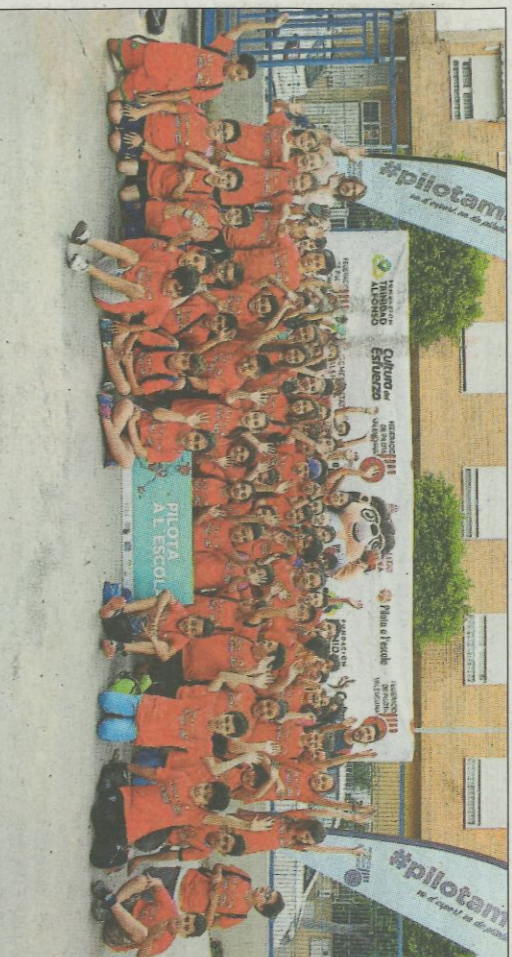
CEIP Marqués de Benicarló. SP