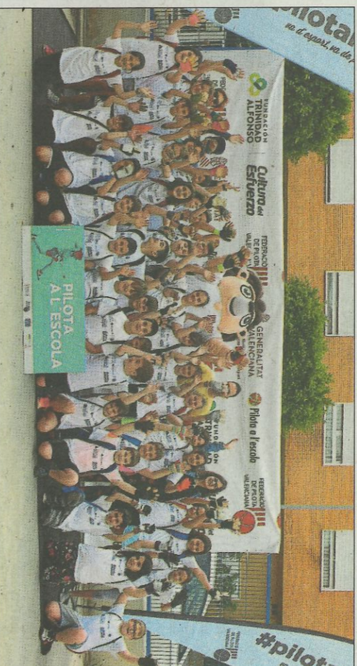
CEIP Felicinada Collell. SP