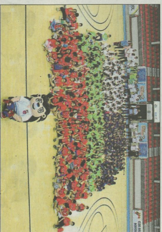
Els assistents a la trobada d'ahir a Benicarló.