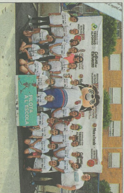
CEIP Mestre Francesc Catal. SP