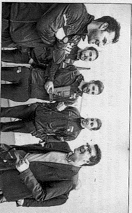
Recepción de la Federació de Pilota Valenciana. Diputació

ter, con fondos provinciales, para recuperar sus viejos trinquets. Es el caso de Carlet, donde el ayuntamiento se quedó en propiedad el