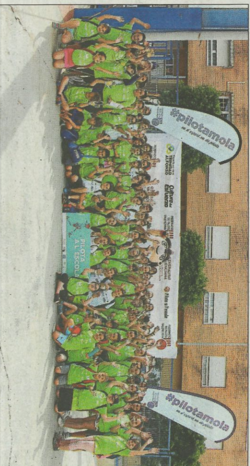
CEIP L'Assumpció. SP