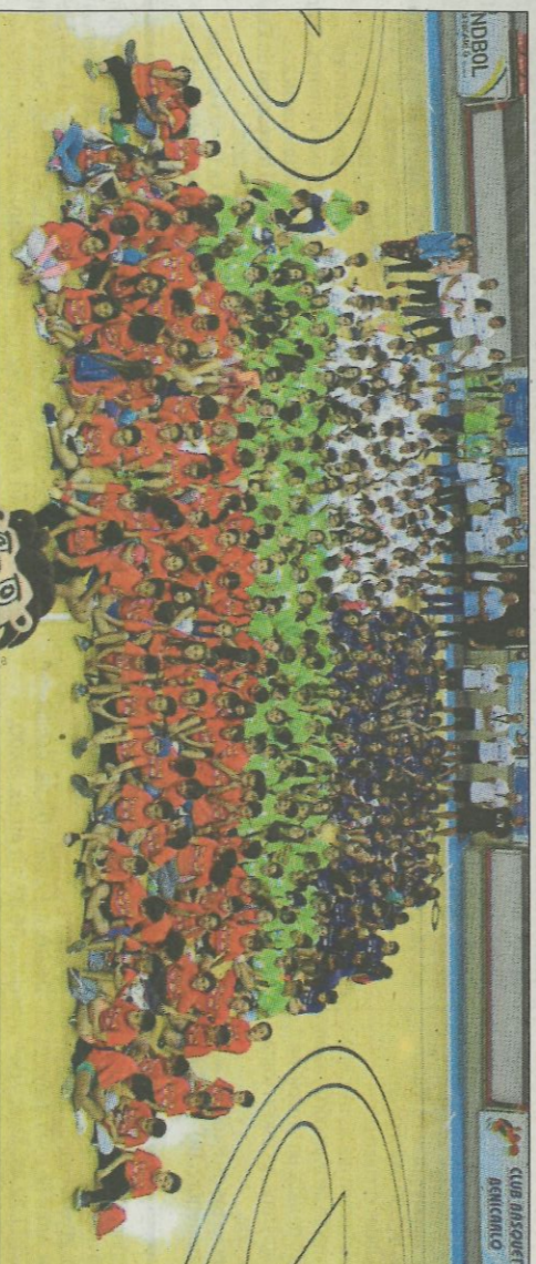
Foto de grup de tots els participants.

Com és habitual, a banda de l'extensa programació de partides, els xiquets i xiquetes han s'han divertit amb els inflables i els tallers de jocs tradicionals relacionats amb la pilota. A més, tots ells han conegut en persona a MAPI, la mascota de la pilota valenciana. Per banda de la Conselleria ha assistit el Di-