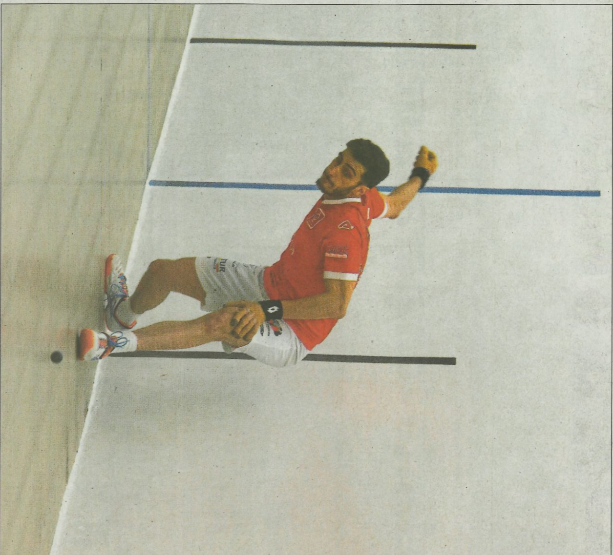
Canari va ser el baluard defensiu de sempre i a més va estar molt encertat en atac. FUNDACIÓ

Canari, per la seua banda, continua demostrant la seua condició de mitger de referència. La defensa sempre és la seua principal virtut i així va succeir a Castelló de Rugat, però el de Xeraco també va destacar i molt en la consecució del quinze, rematant i trobant fàcilment la gal·leria.