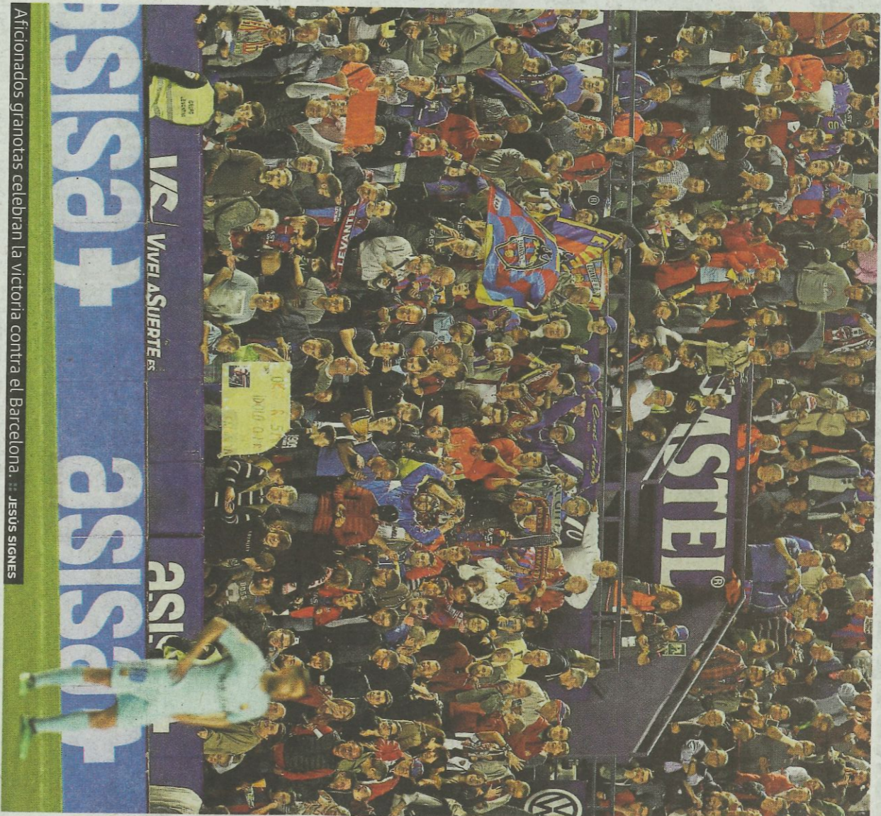
Aficionados granotas celebran la victoria contra el Barcelona.

Más libertad de actuación tiene el consejo a la hora de aplicar políticas para fidelizar a la afición. En ese sentido, el Levante decidió tras el último descenso regalar el pase