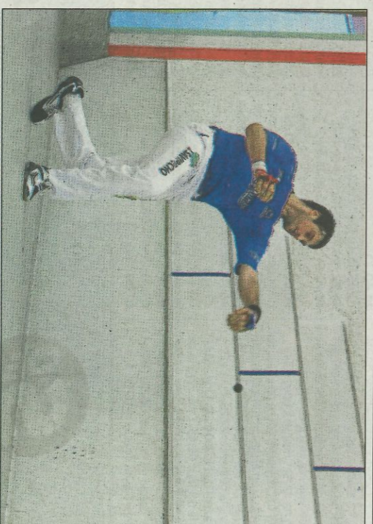
Genovés II va guanyar l'homenatge a Navarro. FUNDACIÓ

On no es va poder jugar ahir va ser al nou frontó de Castelló. La inauguració va ser ajornada fins a nova ordre a causa del temporal i el risc de pluja a l'hora de l'encontre. El cartell anunciava a Fageca i Alvaro contra De la Vega i Bueno.