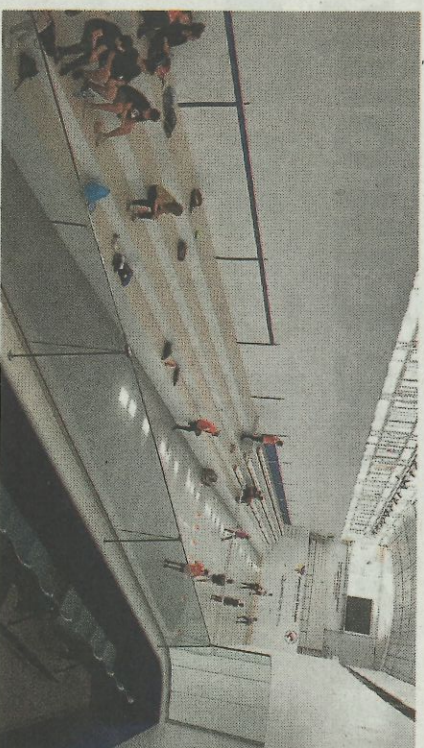
Escolares juegan ayer a pilota en el trinquet de Pelayo.

Más bien se quiere recibir a los escolares sin generar molestias o plantearse organizar otro tipo de eventos. Si se logra un elevado grado de insonorización, si se estudiara organizar partidas nocturnas, apuesta que ha tenido éxito en otros trinquets como Gandia o Vila-real.