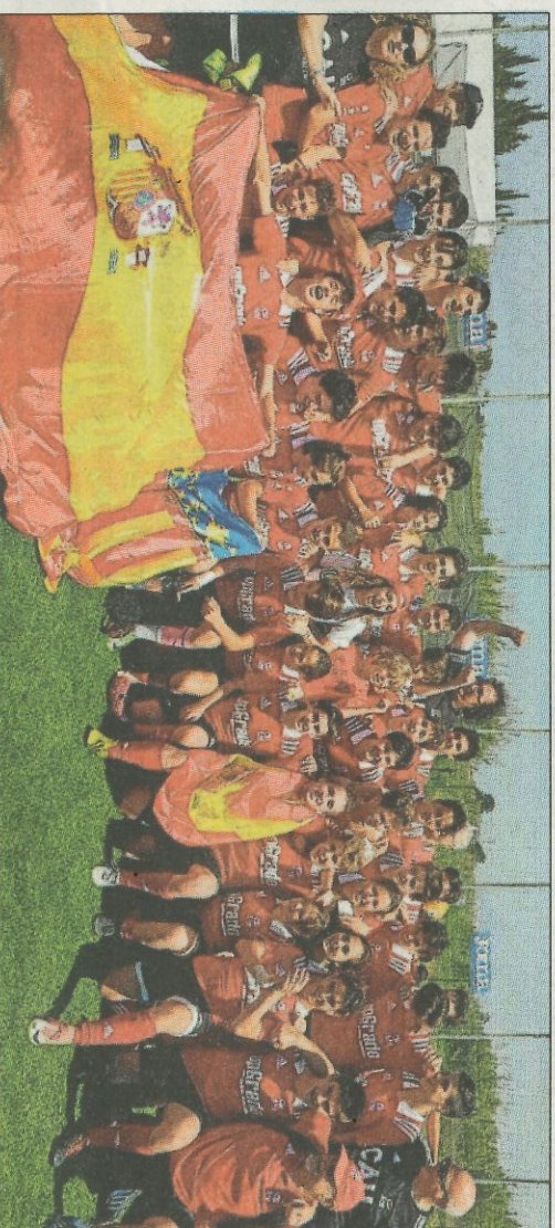
Los jugadores sub-16 del CAU Valencia celebran el título nacional de rugby.