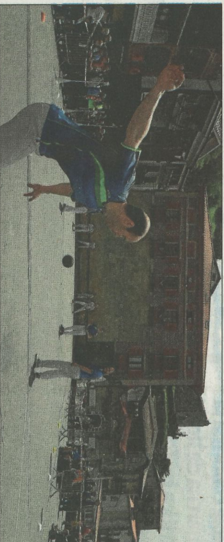
Partida a «llargues»/«bote luzea» en Pasajes de San Juan.

Pasajes quiere recuperar el esplendor del pasado, cuando su puerto era el principal del comercio vasco y del comercio castellano. En aquel estuario del río Oyartzun soñaba con alcanzar la gloria Bias de Lezo , el mismo que derrotó a los ingleses en la crucial batalla de Carragena de Indias; en sus alrededores se inspiraba Victor Hugo , quien sabe si disfrutaba de algún duelo de pelota. Y de aquellas aguas que penetran en el corazón euskaldún partió el general francés La Fayette para luchar por la independencia de los terri-