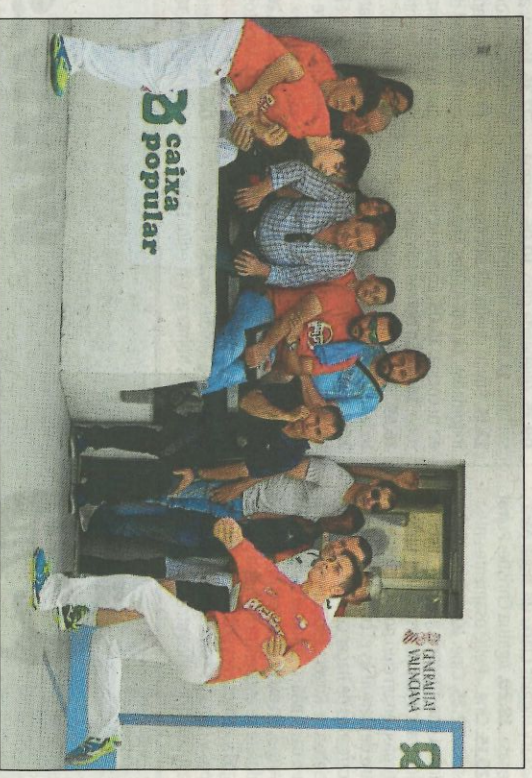
Moment de la final de la Lliga Promeses al trinquet de la Pobla.

Els vencedors van manar en el marcador durant la major part de la partida, aconseguint un avantatge màxim de tres jocs. Però els dos Alex i Hilarí mai van donar la final per decidida i van igualar a 50. Els dos últims jocs van ser per als que saberen gestionar millor la pressió del moment.