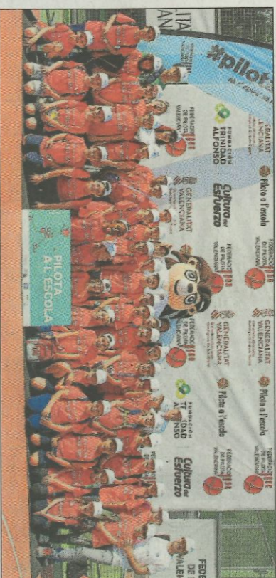
CEIP Mare Nostrum-Valencia SD