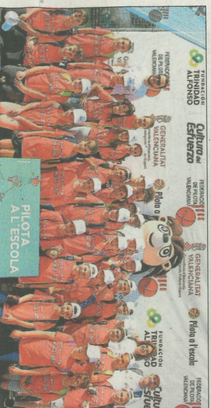
CEIP Sant Vicent Ferrer-Faura. SD