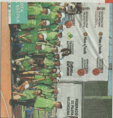
CEIP Fernando de los Rios-Burjassot. SD