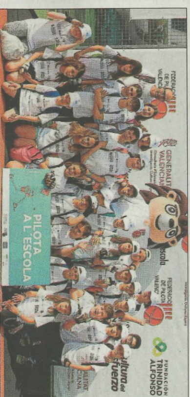
Escola La Masia-Museros. SD