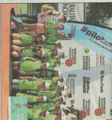
CEIP Ausiàs March-Sagunt. SD