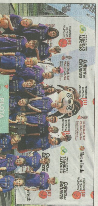
Col·legi Luz Casanova-Valencia.