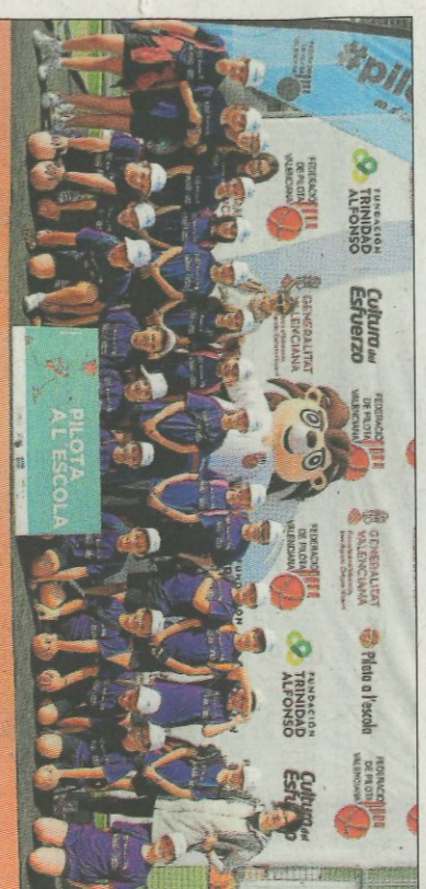
Col·legi Sagrado Corazón-Meliana. SD