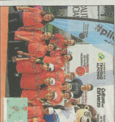
Sagrada Família-Massamagrell. SD