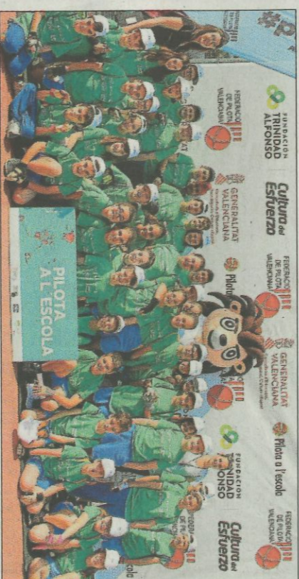
Col·legi Argos-Valencia. SD