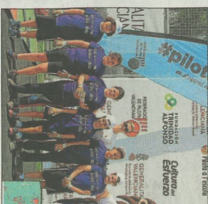
Col·legi Europa-Valencia. SD