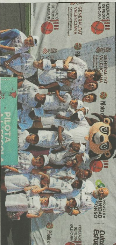
CEIP Antonio Ferrandis-Paterna. SD