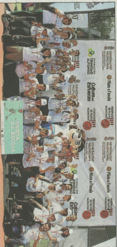
CEE Siquema-Torrent. SD