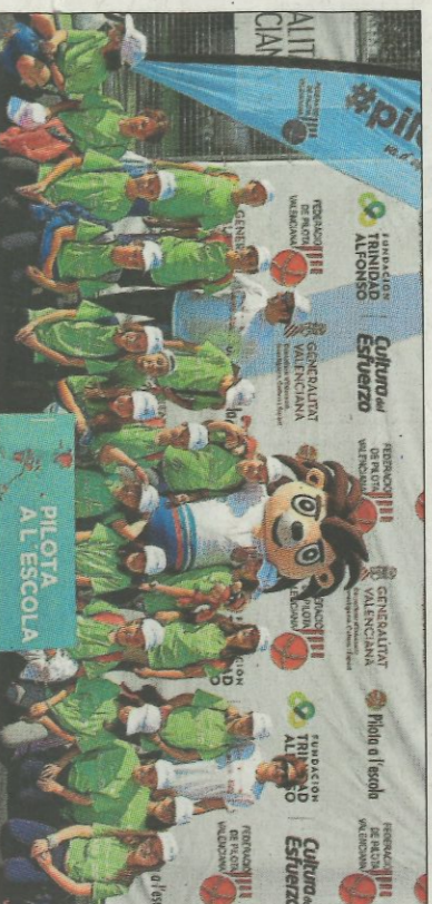
CEIP La Muralla-Canet d'En Berenguer. SD