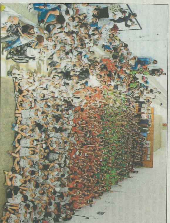
Foto de família.