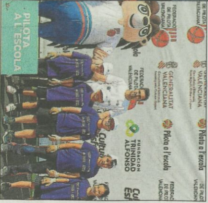
Col·legi Hernández-Vianova de Castelló. SD