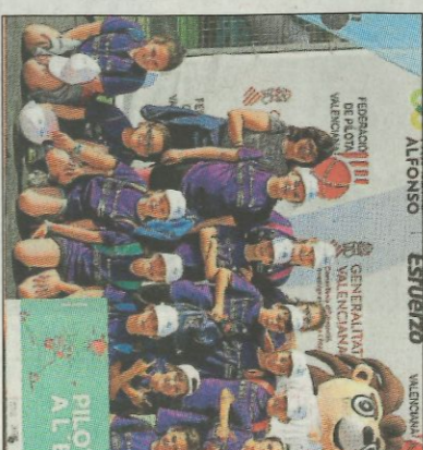
CEIP Mediterrani-Meliana. SD