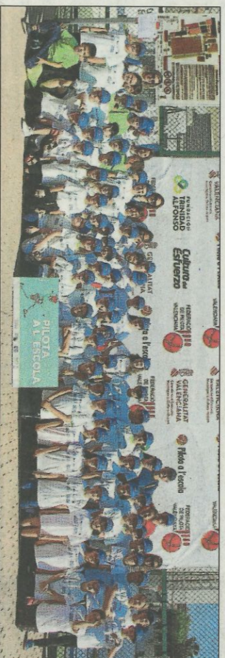
CEIP Hort de Palau-Oliva, SD