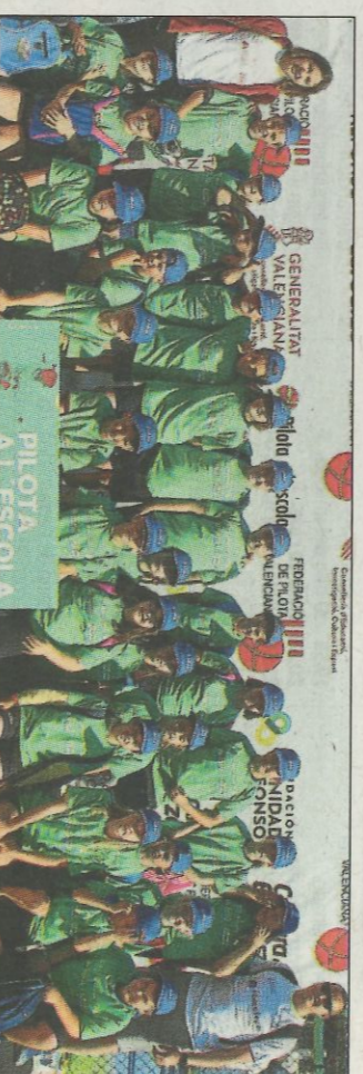
CEIP San José de la Mortaña-Oliva. SD