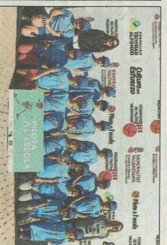
CEIP Les Foies-Gandia-Grau. SD