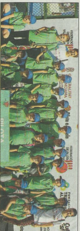
CEIP Vergé Desemparats-Oliva. SD