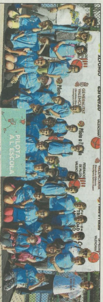
CEIP Les Fies Gandia-Grau. SD