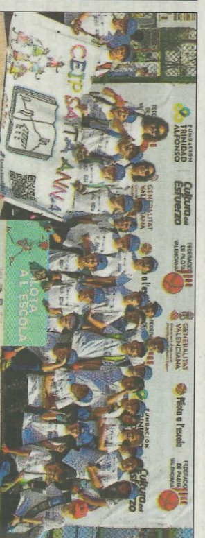
CEIP Santa Anna-Oliva. SD