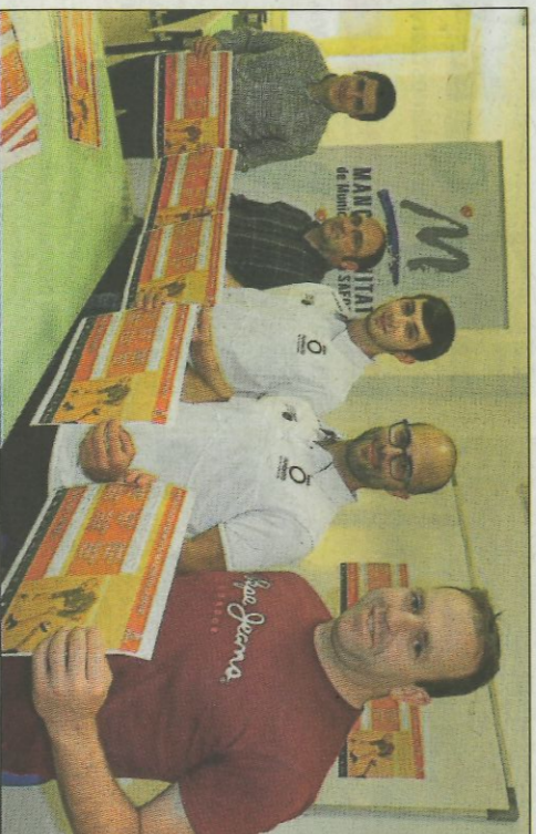
Moment de la presentació d'ahir a Gandia. FP

L'altra gran novetat és la presència de pilotaris no massa habituals