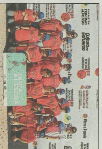
CEIP La Carrasca-Oliva. SD