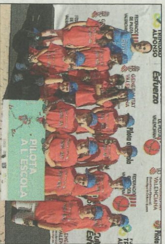
CEIP Bricadim-Beniarbeig, SD