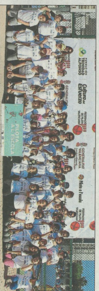
CEIP Lluís Vives-Oliva. SD