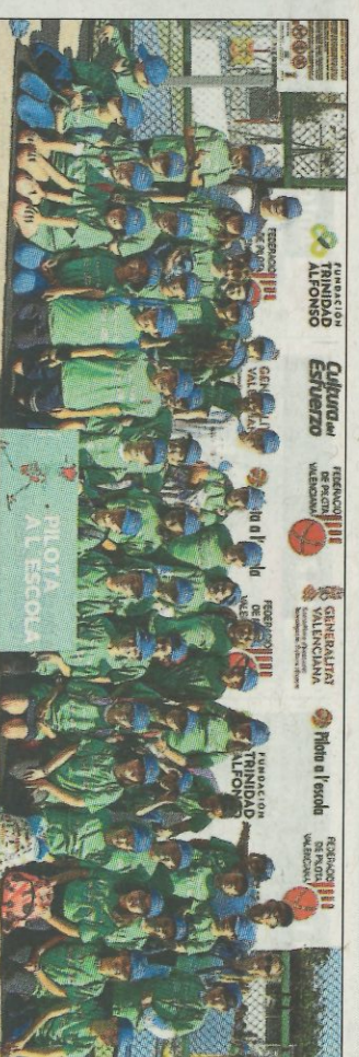
CEIP El Rebollet-Oliva. SD