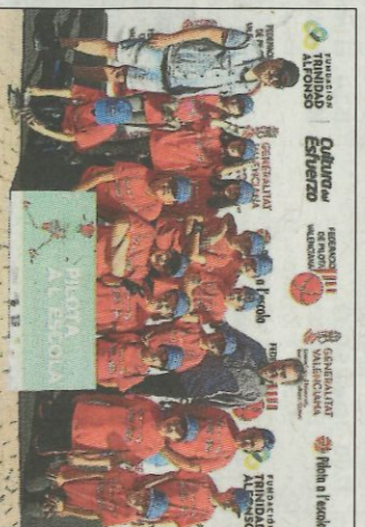
CEIP S. Pere Apòstol-L'Alqueria Contessa.