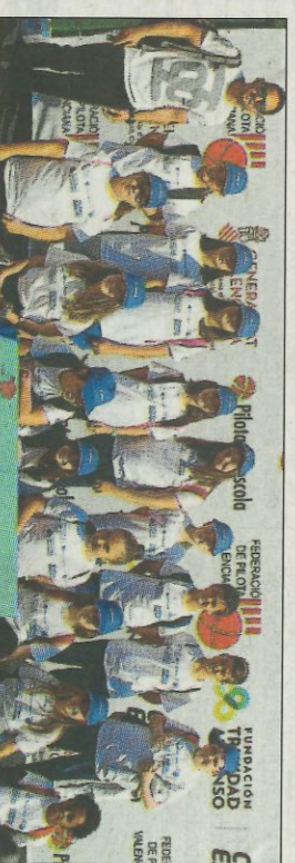
CRA. Ribera Baixa-laurí, SD