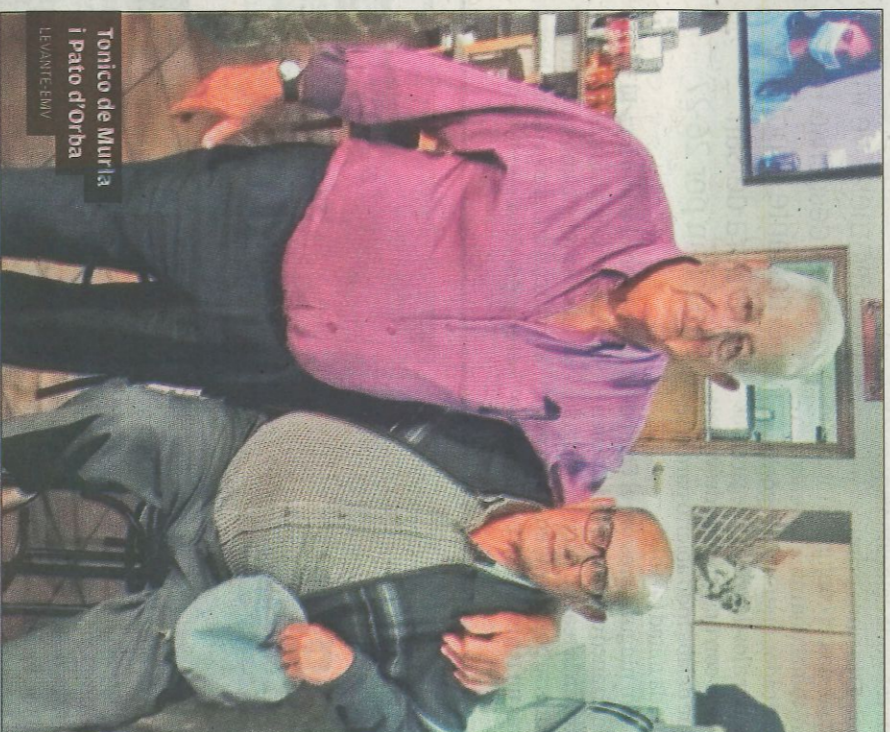
Tónico de Murria i Pato d'Orba LEVANTE-EMV

quedar bocabadat amb l'exhibició del d'Orba.