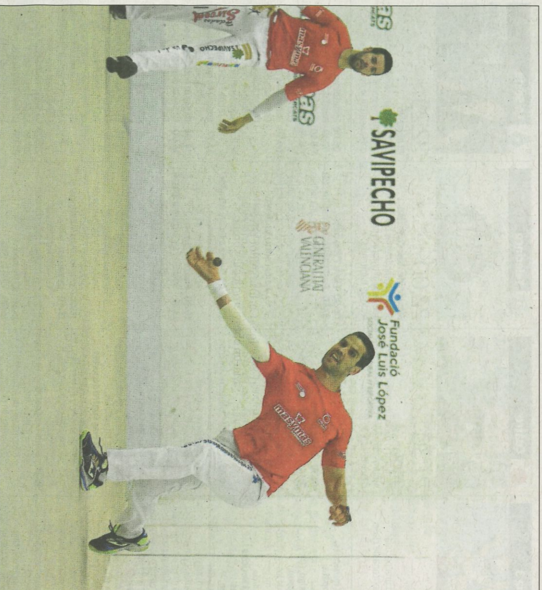
Diferents moments de la jornada de cloenda del III Trofeu Mixt Masymas, aïrir a Pedreguer. FUNDACIÓ