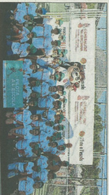
CEIP Ausias March-Benidorm. SD