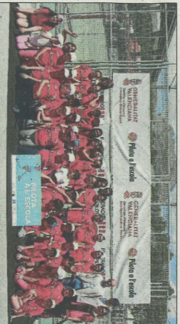
CEIP Miguel Hernández-Benidorm. SD