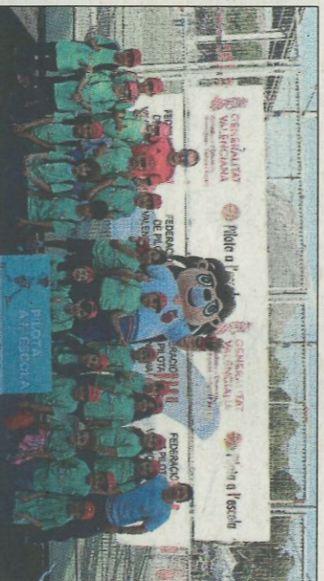
CEIP Mirantot Callosa d'En Sarrià. SD