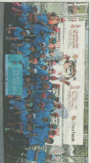
CEIP Les Rotes-Altea. SD