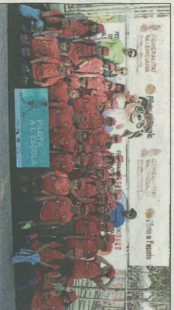
CEIP Gasparot-La Vila. SD