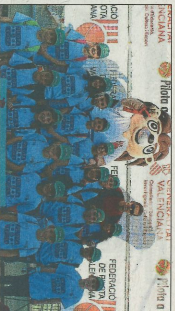
CEIP Cap d'Or-Tenllada-Moraira. SD