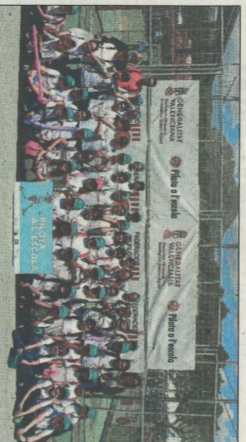
CEIP Primo de Rivera-Crevillent. SD