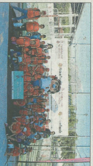
CEIP Vasco Núñez de Balboa-Benidorm. SD