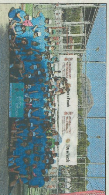
CEIP Els Tolls-Benidorm. SD