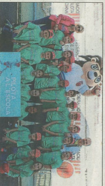
CEIP La Romana-La Romana. SD