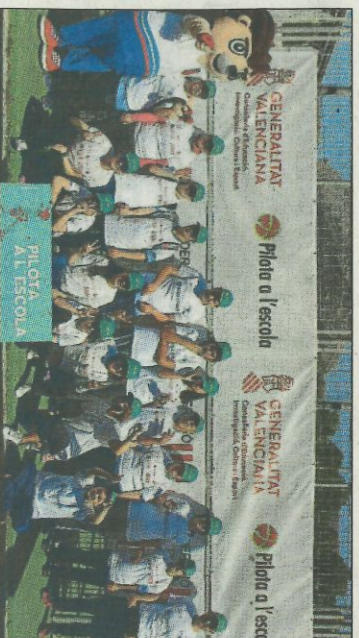
CEIP Secanet-La Vila. SD

Federació de Pilota Valenciana TROBADES PILOTA A L'ESCOLA