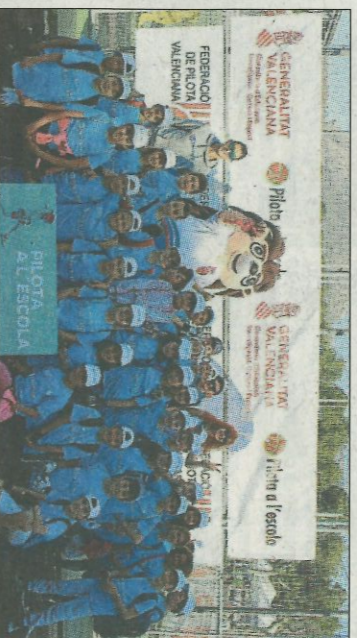
CEIP Santa Maria Magdalena-Poble Nou Benitachell. SD