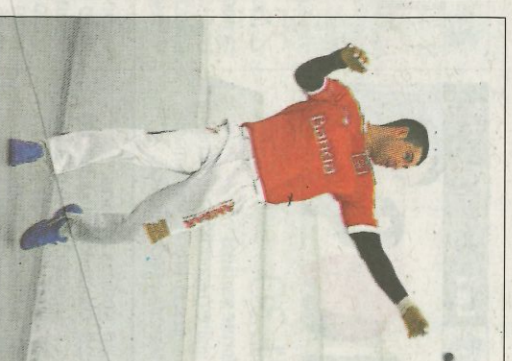
De la Vega d'Almussafes. FUNDACIÓ