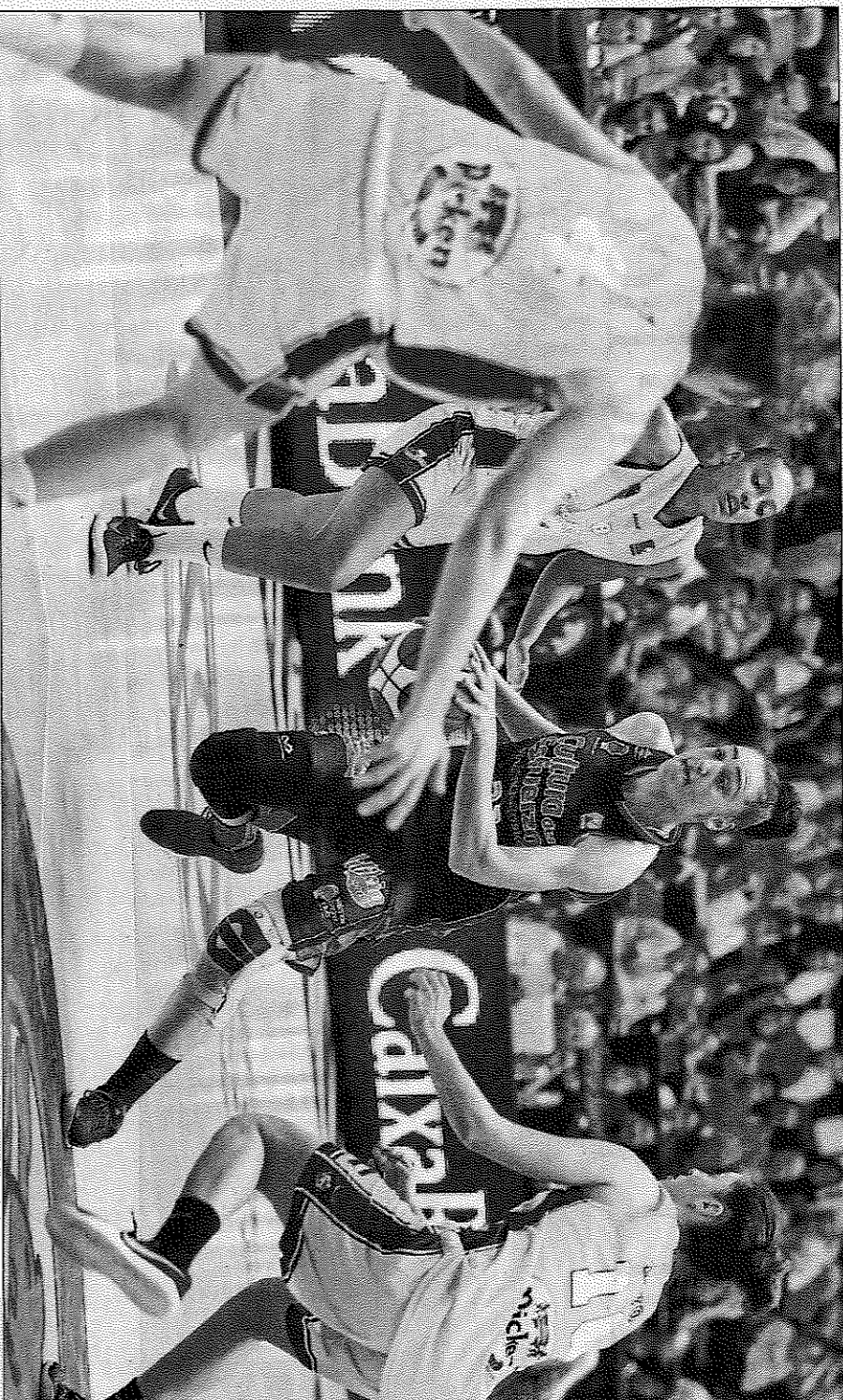
El Picken Claret comenzó bien, pero se fue apagando.