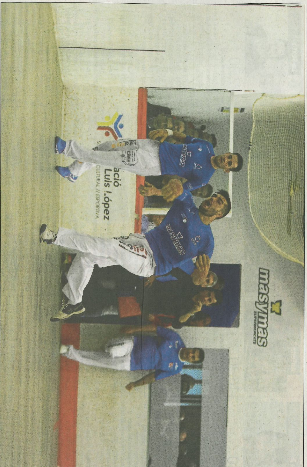
Francés, Jesús i Tomàs II jugaran la segona semifinal del torneig d'escala i corda. FUNDACIÓ