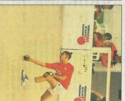
Murcia en acció. SD