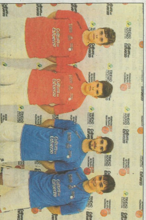
Jugadors de la final absoluta sub-18 de raspall. SD