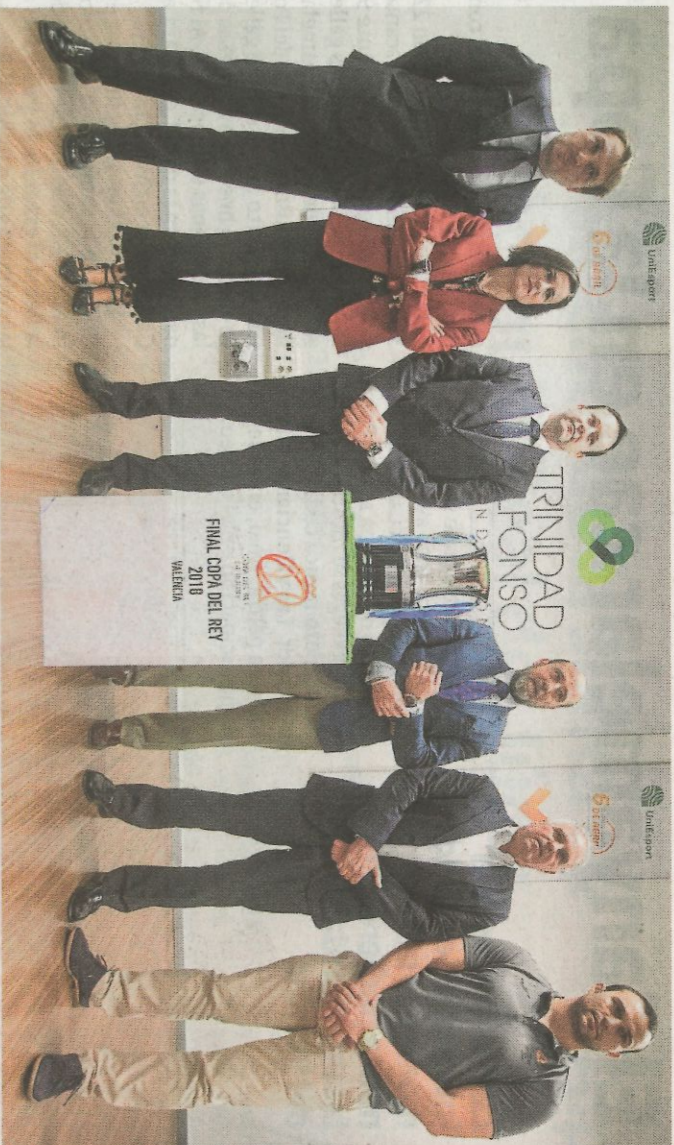
Los presidentes de los finalistas flanquean la Copa, junto a Catalán, Tejedor, Feijoo y Semperé.