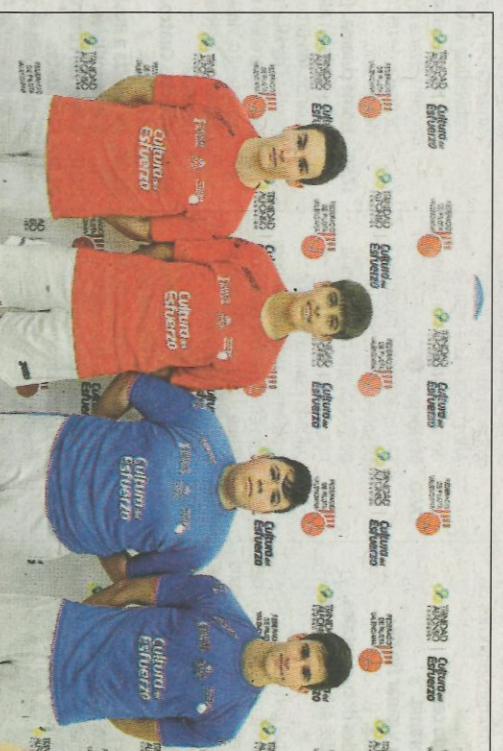
Jugadors de la final sub-23 de raspall. SD