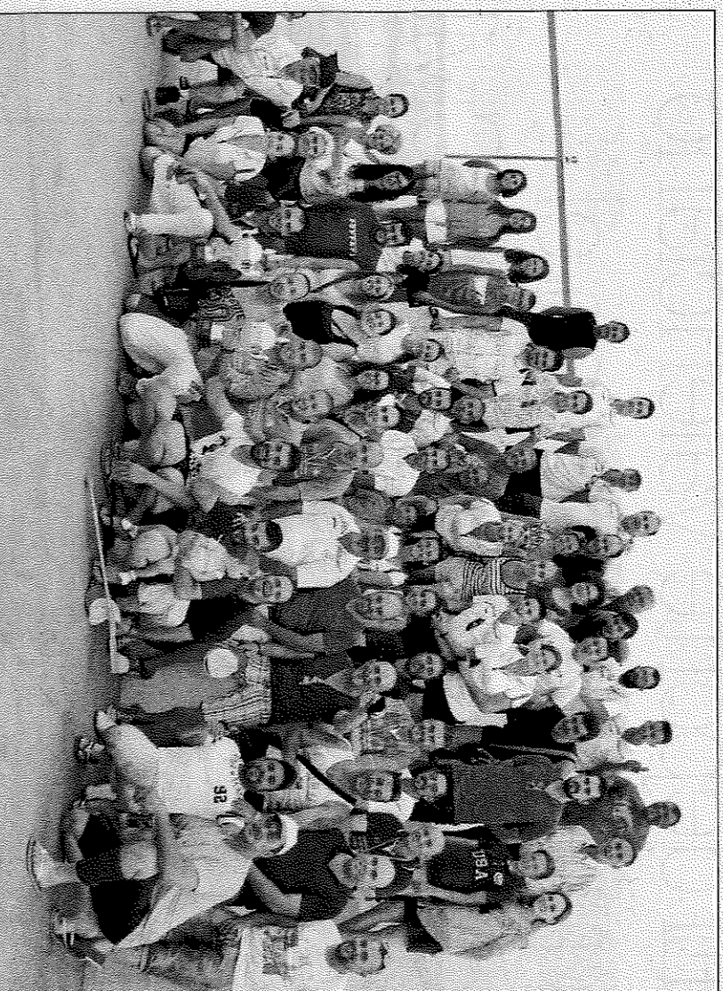
El club de pilota de Torrent ha crescut amb força en els últims anys.

El club de Torrent va començar amb no arriba 30 membres i només dos equips. Tanmateix, la veu es va córrer. La pilota tornava a Torrent. «En quant l'ajuntament es va fer càrrec, va vindre molta gent a apuntar-se, molts que volien jugar. Jo tinent és una ciutat i entre la gent que venia d'abans i la nova, amb ganes