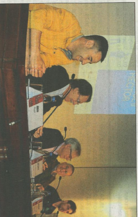
Moment de la presentació de la final a l'Aula Magna de la UV. FP

Puchol III i Jesús van ser els representants de cada bàndol aspirant al títol. No hi ha pronòstic. Els dos