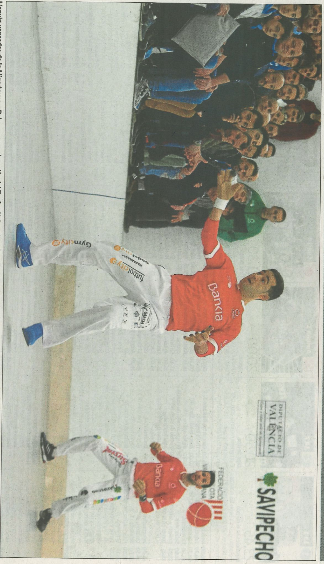
L'equip vencedor de la Lliga torna a Pelayo, ara amb motiu del Trofeu Universitat de València. FUNDACIÓ