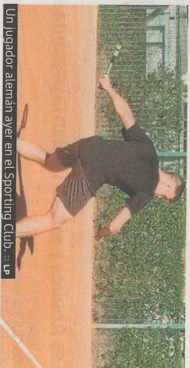
Un jugador alemán ayer en el Sporting Club. :: LP

:: EFE. La rotura del mástil del VO65 Vestas estadounidense de Charlie English, a 100 millas al sur de las Malvinas y el fuerte ataque del Dongfeng de Charles Caudrier sobre el líder, el Brunel fueron las notas destacadas de la 14ª jornada de la Volvo Ocean Race entre Auckland e Itajaí (Brasil).