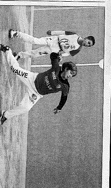
Jugadors d'El Puig i Massanagrell.