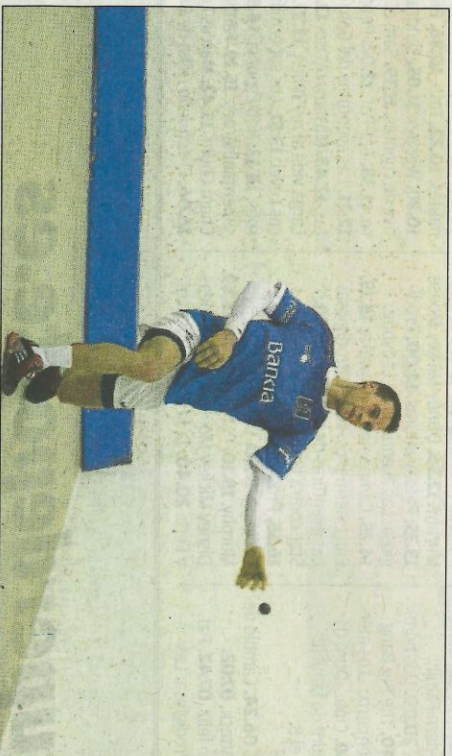
Moltó jugarà en plenitud de facultats en la defensa del títol. FUNDACIÓ

I ahir va ser quan el defensor del títol va anar al l'escenari de la partida, el trinquet de Bellreguard, per a completar un entrenament llarg i exigent. «Al final he parat per cansament, després d'hora i mitja ti-