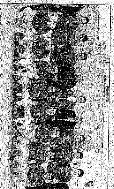
Jugadors de la Liga Promeses Caixa Popular.