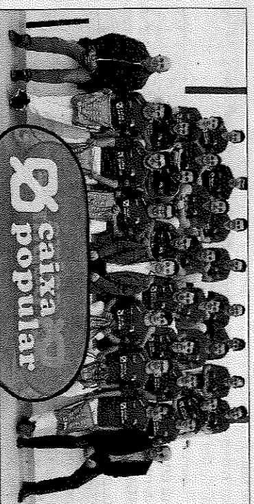
Els protagonistes dels campionats, ahir a Pelayo.

En la Liga 2 competiran cinc trios, igual que en la Liga Promeses. En els dos campionats parti-