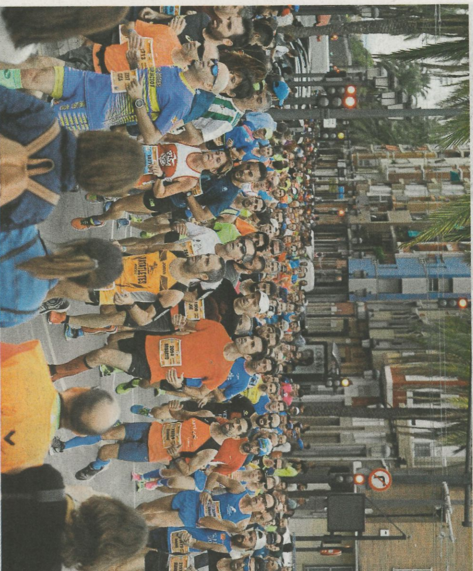
Atletas durante el último Medio Maratón de Valencia.