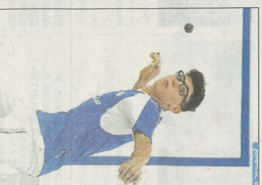
Martí, en la Lliga Dos. FEDERACIÓ