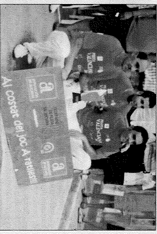
Rodrigo també va jugar amb Álvaro de Tíbi.