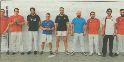
Membres del CPV Socarrades de Campanar. FPV