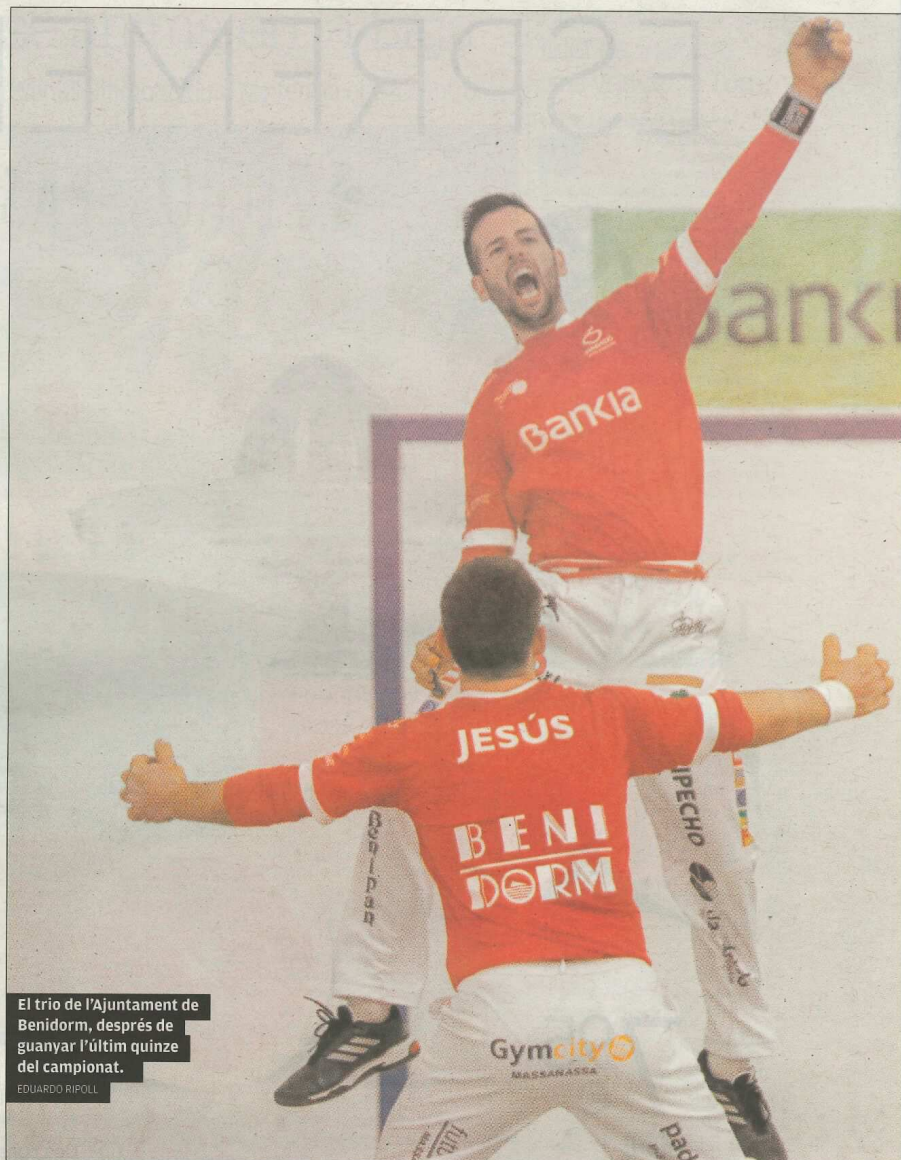
El trio de l'Ajuntament de Benidorm, després de guanyar l'últim quinze del campionat.

Amb 45-45 hi havia qui ja en tenia prou. «No es pot jugar més», s'escoltava a l'escala. Els sis jugadors estaven donant-ho tot i el campió era un misteri. La tensió sobre les lloses es podia quasi tallar i va transformar-se en alguna polè-