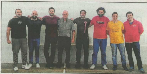
El CPV Tamborí, en funcionament des de 1997. FPV

Per últim, el club de Pelayo manté viva la pilota al centre de la ciutat gràcies, entre altres, a la figura de Peluco i la seua escola per a xiquets.