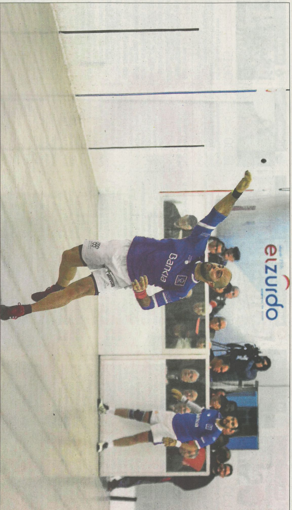
La millora de l'equip de la Llosa de Ranes a mesura que ha avançat la competició ha estat evident. FUNDACIÓ