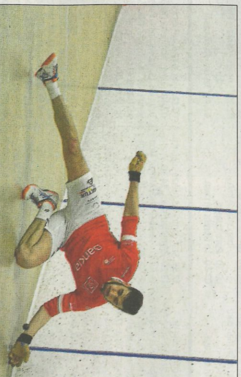
L'equip de Senyera ha sigut el millor de la fase regular. FUNDACIÓ

No solament això, este conjunt arriba a la semifinal amb un Canari