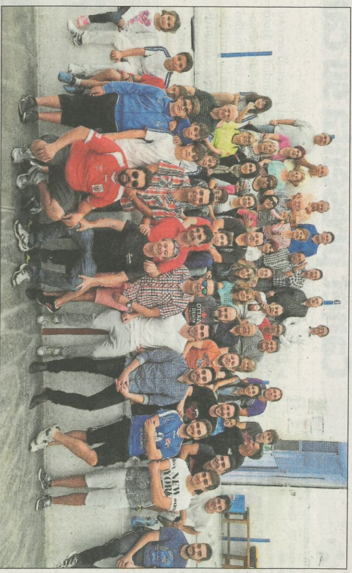
L'afició de Petrer, que ja va acompanyar a Miguel fa uns anys, es bolcarà enguany amb Francés.

La temporada passada, l'afició de Pere Roc II va ser una de les atraccions a la galeria del rest. «Enguany hi haurà un grup majoritari al mateix lloc, encara que també estarem reparits per més llocs. A mi m'agrada votar 'Des del dau', afirma Calvo, que també assenyala una de les novetats dengany. «Haurèm de par-