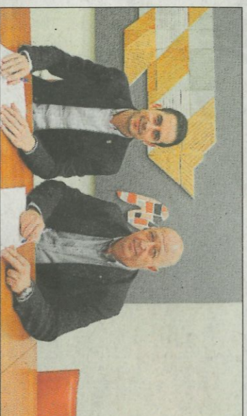
La Mancomunitat de l'Horta Sud també recolza la pilota.

El cap de setmana passat es disputà la segona fase dels XXXVI Jocs Esportius de la Comunitat Valenciana de frontó individual en les localitats de Dénia i Tavernes Blanques. Jugaren prop de 150 esportistes passant a les finals 50 jugadors de les categories benjantí, aleví, infantil, cadet i juvenil, nivell A i nivell B, en les deu categories de competició. Estaran representades 25 escoles en la fase final sent l'escola del Puig amb 11 esportistes, l'escola més destacada. Les fases finals es jugaran a Dénia, 25 de març.