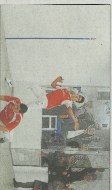
Jugadors participants en el Caixa Popular.