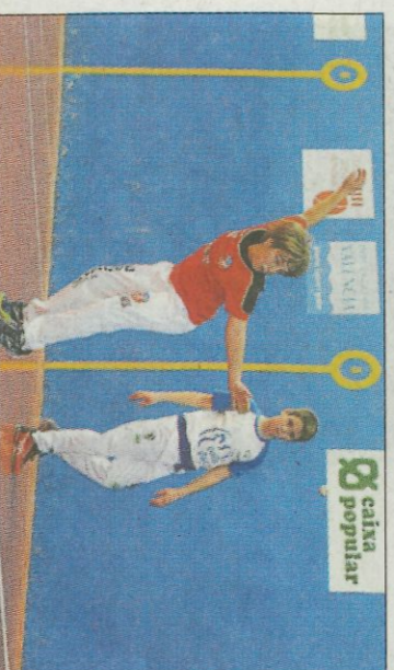
Jugador aleví de l'escola d'El Puig.