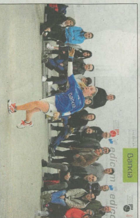
La jornada inaugural es va viure al carrer de pilota de Borbotó.

fase regular de la Lliga Bankia d'elit de Raspall Femení. Es van disputar tres partides de gran nivell. La jornada inaugural va començar amb un duel de màxim nivell que va enfrontar als grans domi-