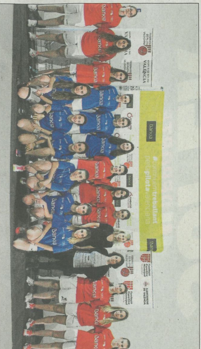
Totes les participants en la presentació de la Lliga Bankia el passat Va de Dona. FPV

La competició, que pretén assolir el lloc de major importància dins el món femení, va començar aquest cap de setmana a la localitat de Borbotó. Aquesta va ser la seu de la jornada inaugural de la